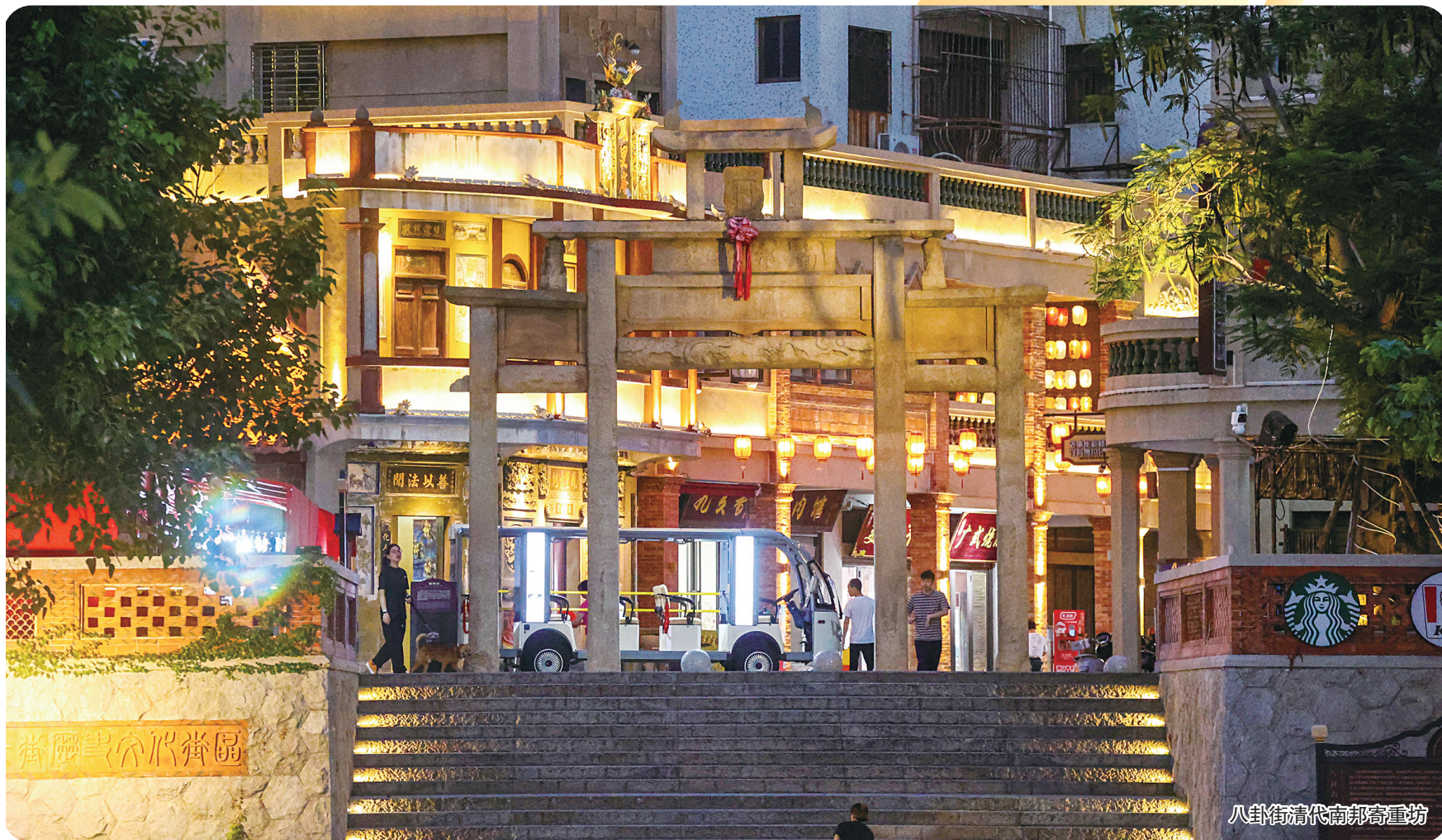
八卦街清代南邦寄重坊