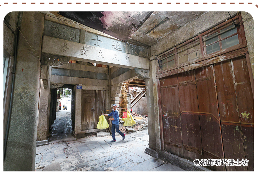
龟湖街明代进土坊