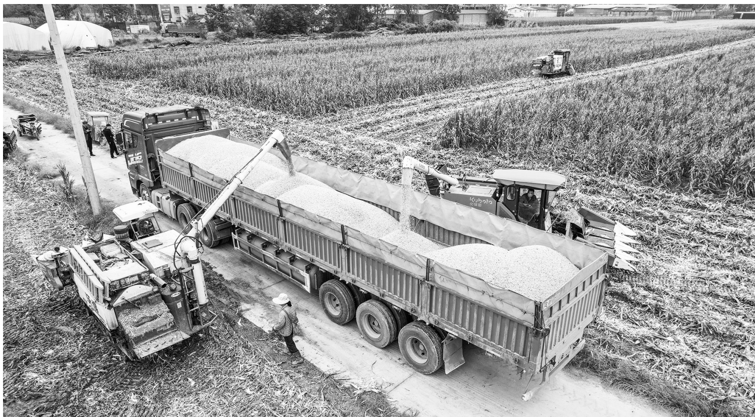
▲多措并举 抢收秋粮 10月14日，在河南省商丘市夏邑县会亭镇，收割机将收获的玉米装车(无人机照片)。当前正值“三秋”生产关键期，为应对阴雨天气造成的影响，各地加强农机和烘干设备调度力度，积极开展湿粮抢烘和晾晒作业，助力秋粮收获。

今年的秋粮收购工作正在陆续展开。针对今年秋粮收购工作重点，刘焕鑫表示，将着力推进市场化收购，强化人员、仓容、资金、运力等要素保障，多措并举引导各类企业积极入市，活跃市场购销；精心组织政策性收