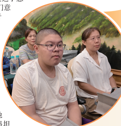
云皓妈妈带着云皓参加新书发布会