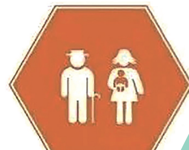
特定年龄、性别人群

答：基本公共卫生服务主要由乡镇卫生院、社区卫生服务中心、村卫生室、社区卫生服务站负责具体实施。村卫生室、社区卫生服务站分别接受卫生院和社区卫生服务