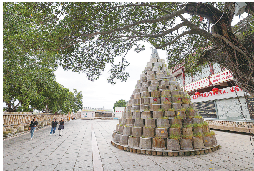
玉湖豆腐厂井沿塔