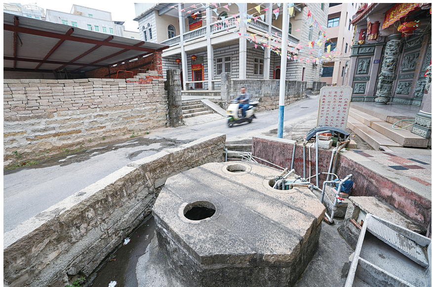
蚶江江湖八角井(俗称“皇帝井”)