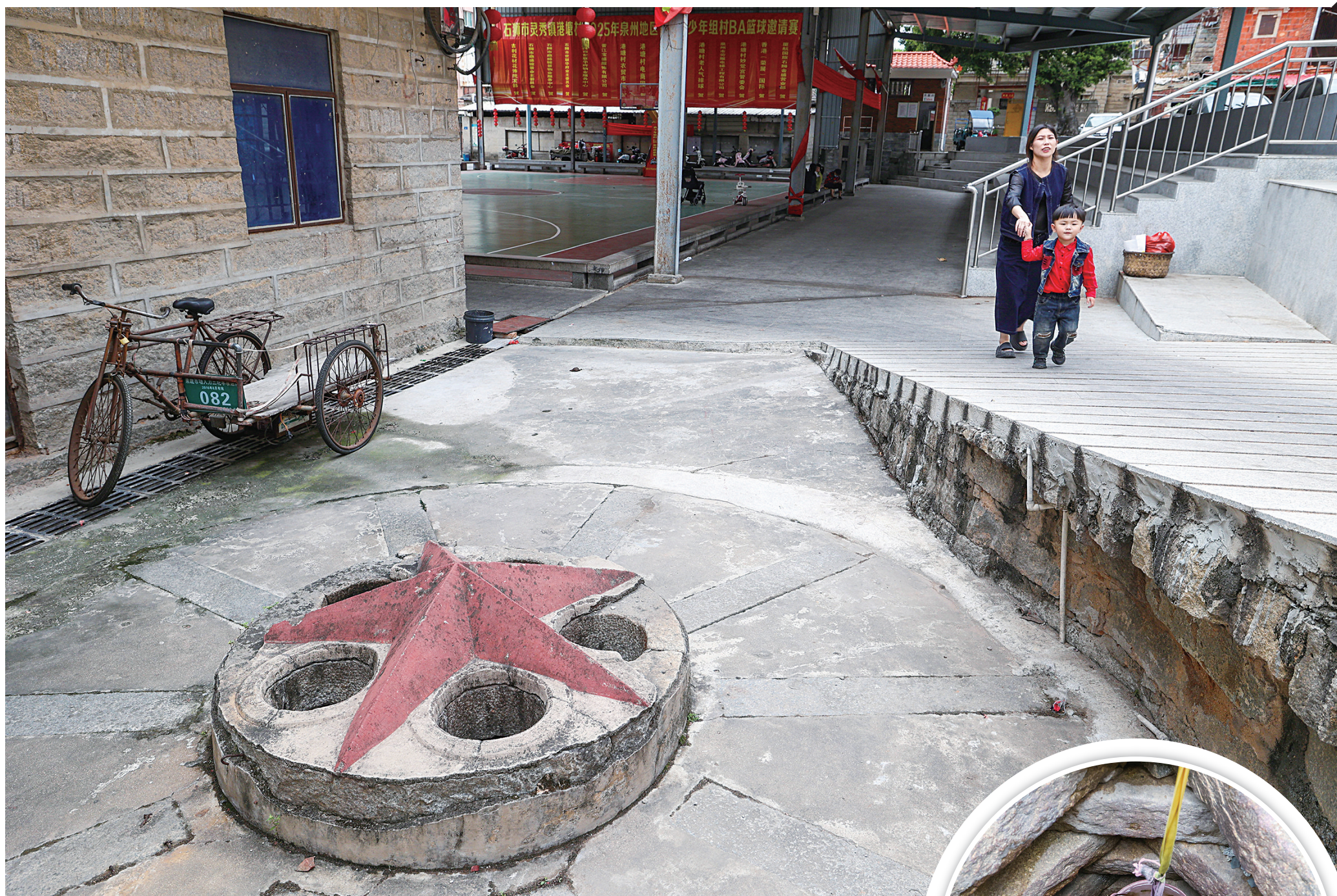
灵秀港塘村五角星水井