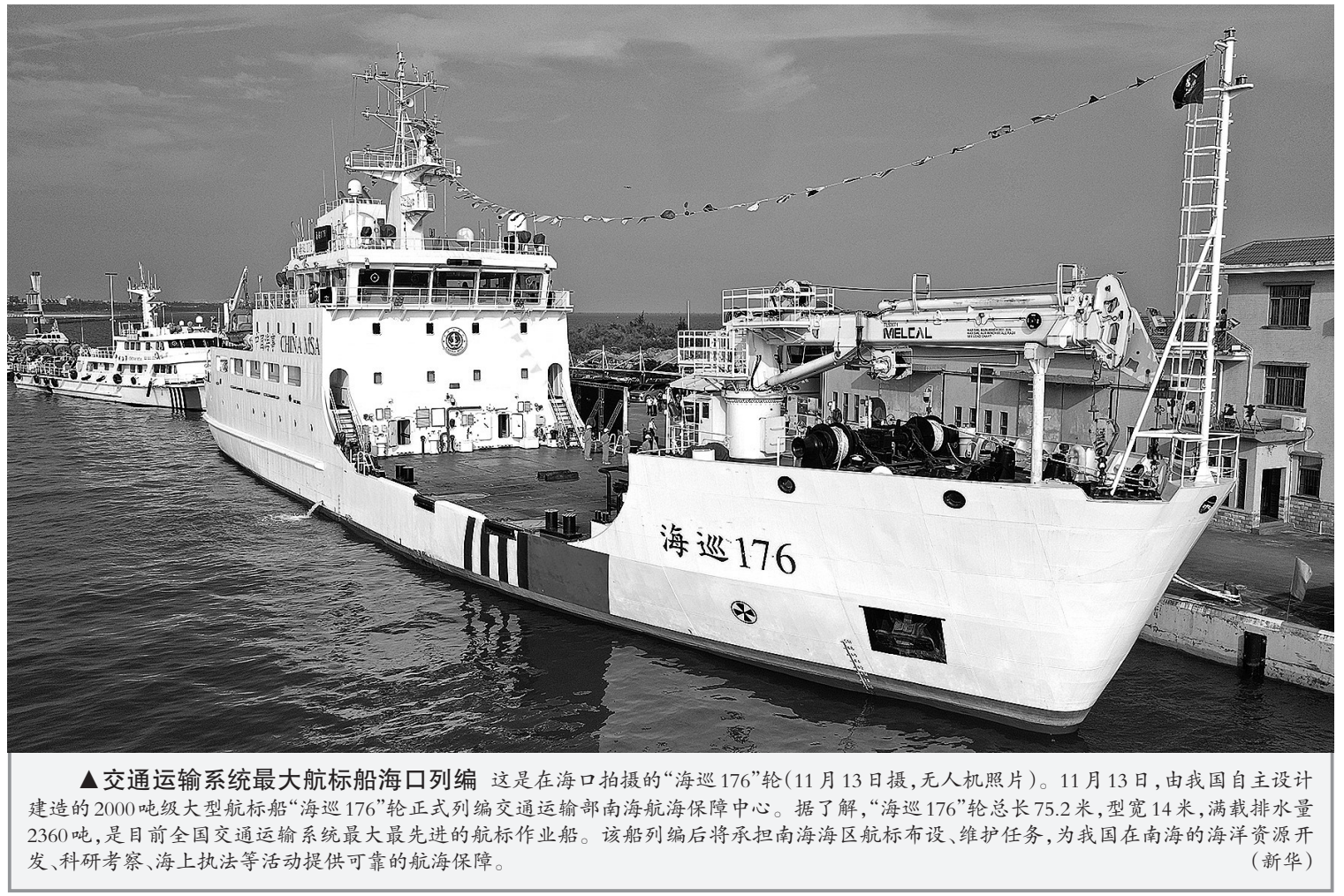
▲交通运输系统最大航标船海口列编 这是在海口拍摄的“海巡176”轮(11月13日摄，无人机照片)。11月13日，由我国自主设计建造的2000吨级大型航标船“海巡176”轮正式列编交通运输部南海航海保障中心。据了解，“海巡176”轮总长75.2米，型宽14米，满载排水量2360吨，是目前全国交通运输系统最大最先进的航标作业船。该船列编后将承担南海海区航标布设、维护任务，为我国在南海的海洋资源开发、科研考察、海上执法等活动提供可靠的航海保障。

害性，以实际行动与“台独”分裂势力划清界限，积极提供相关违法犯罪线索，对于协助公安机关抓获相关犯罪嫌疑人有功人员，视情给予5万至25万元人民币奖励。