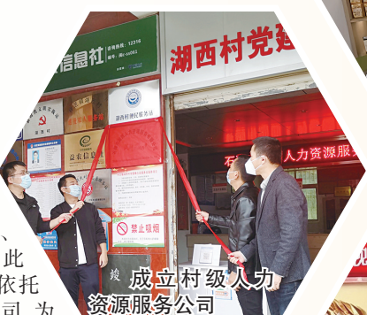
成立村级人力资源服务公司

带货，让“山海协作”的农产品走出大山、走进市场。此外，湖西村还依托村集体经济公司，为乡村振兴注入产业“活水”。最后，通过实施农田土地提升、闲置建设用地出租等举措，进一步做强村集体经济的“底气”。