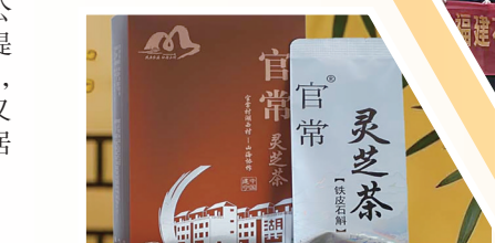
与共建支部推出助农产品