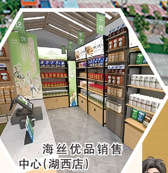
海丝优品销售中心(湖西店)