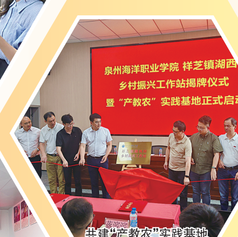
共建“产教农”实践基地