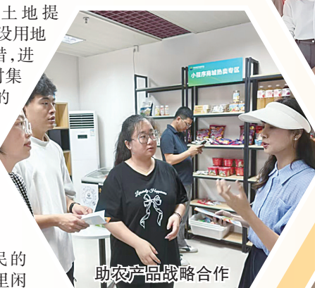
助农产品战略合作