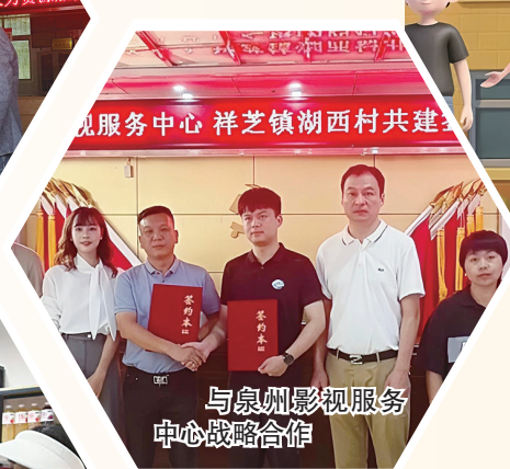
与泉州影视服务中心战略合作