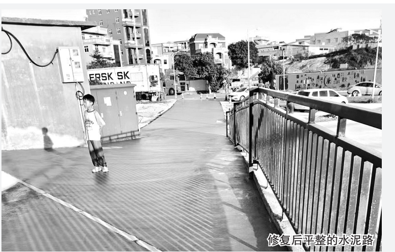
修复后平整的水泥路

本报讯 近日,东埔一村东明殿至和马支路道路硬化工程正式竣工投入使用。这条全长85米、宽5米的水泥路彻底告别昔日沙土路“风起扬尘、雨落泥泞”的旧貌,成为村民出行的“舒心路”。