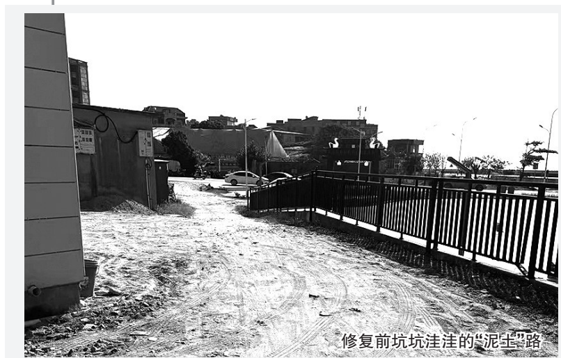
修复前坑坑洼洼的“泥土”路