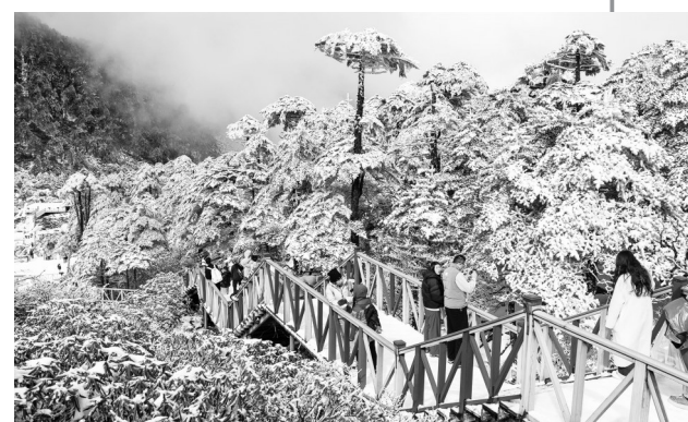
▲大理苍山：银装素裹美景引客来 11月24日，云南大理苍山冰雪景观吸引众多游客前来观赏。受冷空气影响，云南大理苍山迎来2025年入冬后的首场降雪。银装素裹的山林与山脚下的洱海、古城相映成趣，构成一幅水墨画卷。

中国第42次南极考察由自然资源部组织，由“雪龙”号和“雪龙2”号两船共同保障，预计于2026年5月完成任务后返回国内。