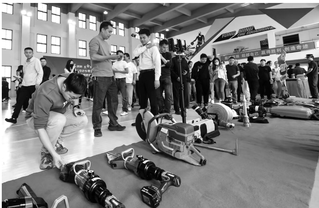
2025年石狮市消防宣传月活动亮点纷呈