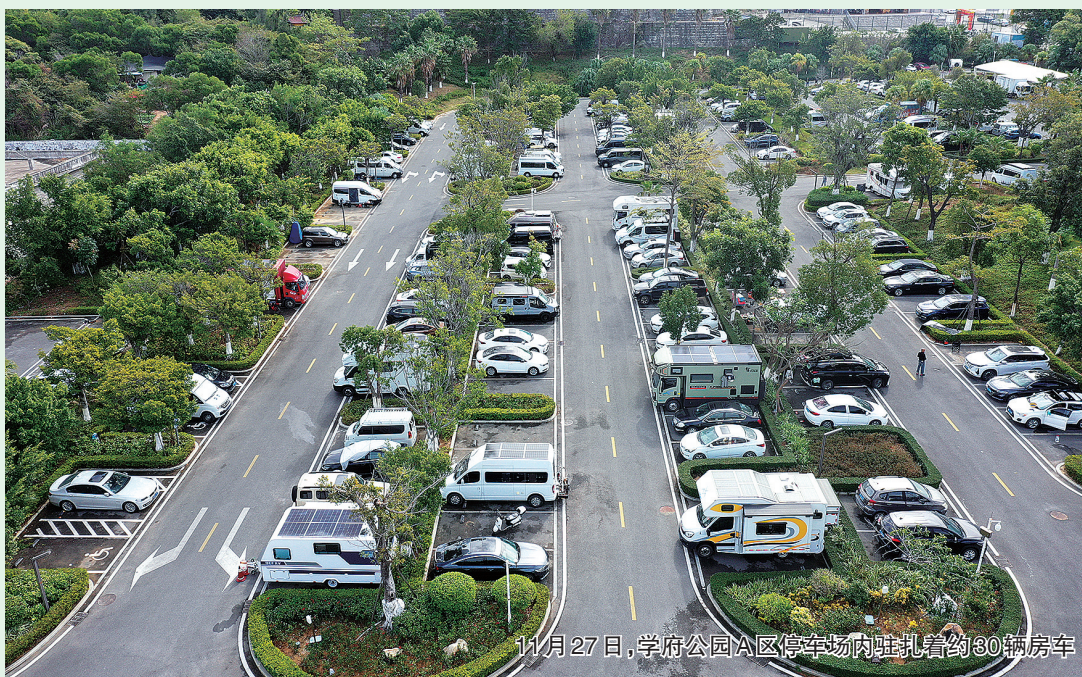
11月27日,学府公园A区停车场内驻扎约30辆房车

冀F、辽P、黑E、蒙A……秋去冬来,又一批“冬南夏北”的“房车候鸟族”抵达石狮,在石狮学府公园、石狮湿地公园等地停车场驻扎,过着“晨起朝露中,夜宿星空下”般令人向往的生活。“房车族”对石狮这座城市印象如何?有哪些意见和建议?11月27日,记者进行了一番采访。