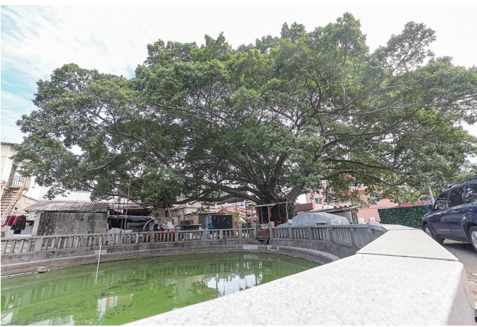
灵秀港塘村约160年树龄的榕树