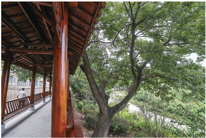
灵秀山约70年树龄的朴树