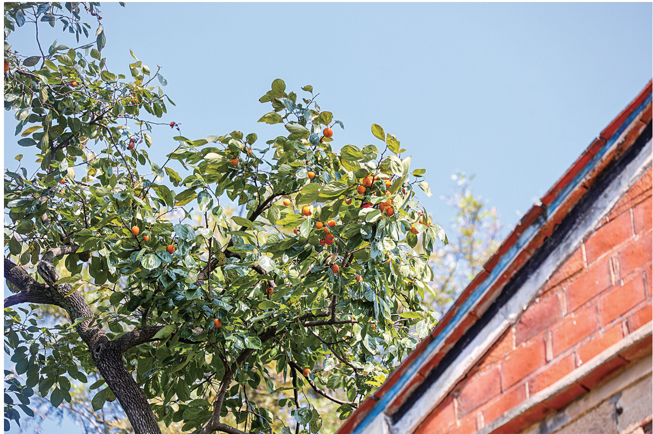
金相院约110年树龄的柿树