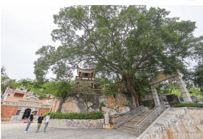
金相院约110年树龄的榕树