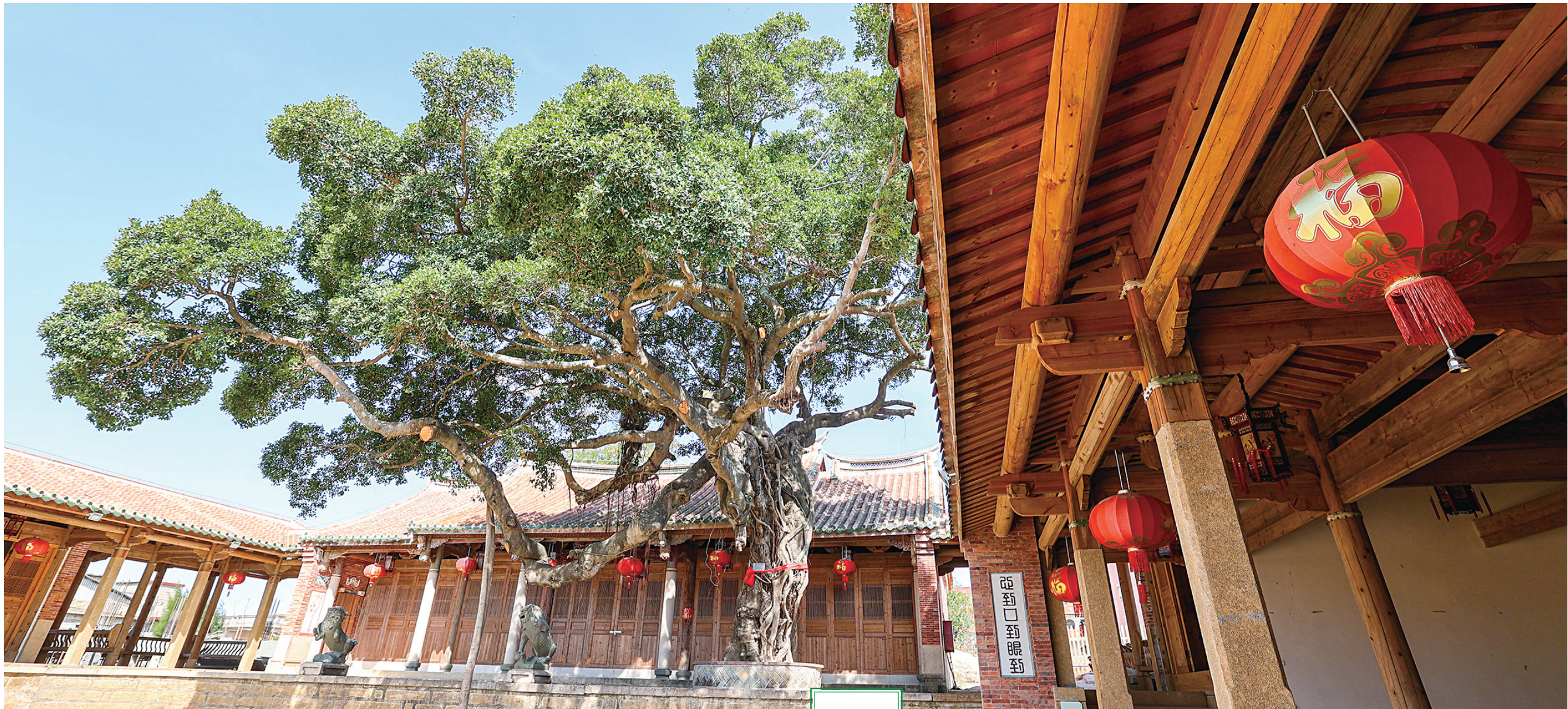
永宁徽国文公祠约310年树龄的榕树