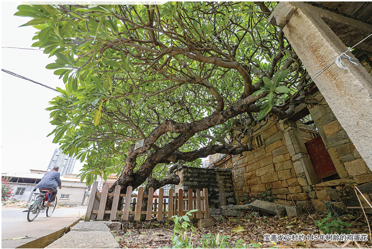
宝盖龙穴村约145年树龄的鸡蛋花