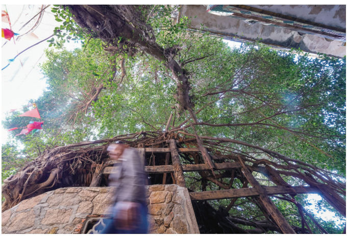
祥芝祥渔村约130年树龄的榕树