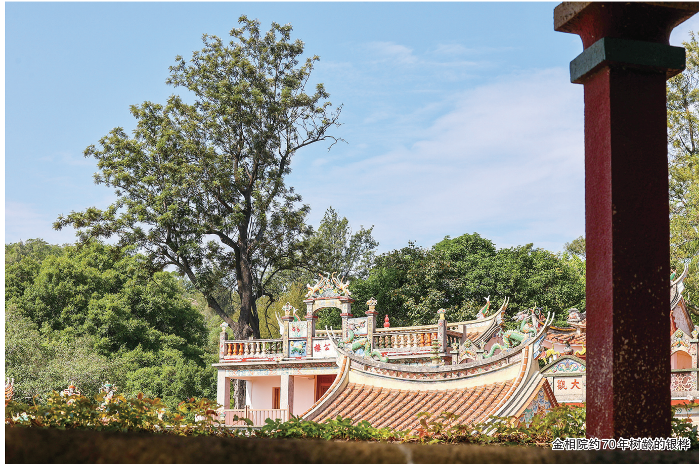
金相院约70年树龄的银桦