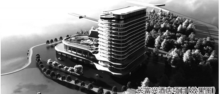
长富酒店项目(效果图)

址永宁梅林码头片区,占地22.35亩,规划建设特色海鲜酒楼、大型室内娱乐中心及主题酒店,形成集餐饮、住宿、娱乐于一体的文旅商业综合体。 此外,今年以来,永宁镇滨海商业广场街区项目也正在抓紧建设中:该一站式文旅新地标项目总用地面积约88亩,规划建设商业街区、民俗演艺广场、文化广场,并配备智慧停车场、游客服务中心等设施。通过洛伽金桥改造、夜市打造及景观提升,项目将融合特色购物、旅游服务、文化体验与生态休闲功能,全力打造滨海文旅综合性目的地。 随着这些重点项目的持续推进与服务机制的不断完善,永宁镇滨海文旅产业正迎来跨越式发展。一个集聚商业休闲、特色住宿与文化体验的十里黄金海岸酒店群已初具规模,将为永宁镇文旅融合高质量发展注入强劲动力,谱写滨海旅游新篇章。(记者 洪亚男)