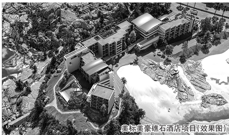
美标美家礁石酒店项目(效果图)

本报讯 12月4日,石狮市十里黄金海岸片区迎来文旅发展里程碑时刻——观音山美标美家礁石酒店与梅林长富酒店两大高端项目正式落地,标志着我市滨海文旅品质提升进入全域升级的新阶段,一幅集商业、住宿、文化与生态于一体的滨海旅游新画卷正在展开。 美标美家礁石酒店项目:致力于融合自然野趣与奢华度假体验,占地27.6亩,选址永宁观音山,依托独特的海蚀地貌与壮丽海景,以“礁石景观”为核心设计理念,建设特色客房、礁石泳池、望海庭院等设施。 长富酒店项目:构建“美食+住宿+娱乐”消费闭环项目,选