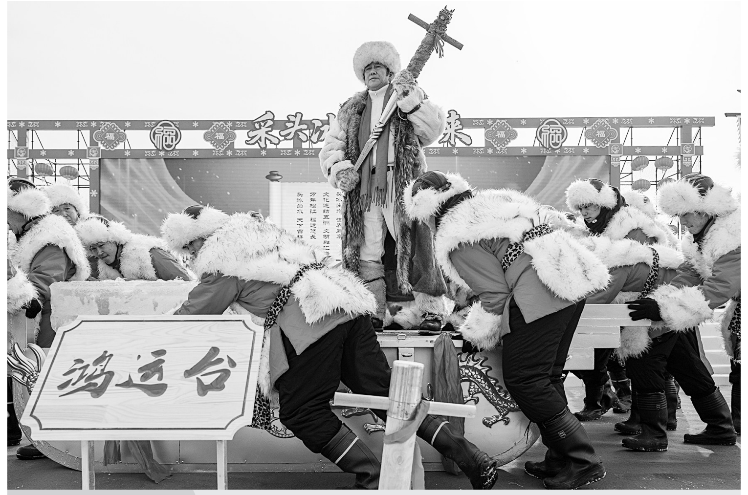
12月7日,在第六届哈尔滨采冰节现场,“冰把头”带领“采冰汉子”运送头冰。12月7日,第六届哈尔滨采冰节在松花江畔开幕,精彩的采冰仪式和民俗体验互动吸引众多市民和游客参与其中,标志“冰城”哈尔滨进入采冰季。

据新华社洛杉矶12月6日电 美国阿拉斯加州与加拿大育空地区边界附近6日发生7.0级地震,阿拉斯加首府朱诺和育空地区部分居民反映震感明显。