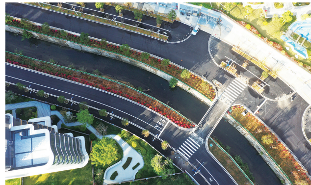
石狮“抓城建提品质”专项行动继续“精美交卷”。经过9个月的攻坚,位于龟湖东改造片区的龟湖溪(宋塘路—香江路)道路近日如期完工。(记者 康清辉 颜华杰)