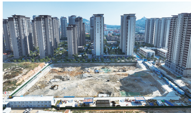
12月4日,作为石狮五大改造片区中最后启动的安置房项目,前坑片区安置房正式拉开建设帷幕。该项目可提供412套住宅,预计在2027年年底建成。(记者 康清辉 李荣鑫)