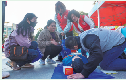
12月5日,2025年石狮市“志愿红 暖狮城”暨“12·5”国际志愿者日主题活动在龟湖公园广场举行。活动现场设置便民惠民展位,为群众提供宣传咨询、志愿服务体验等服务。(记者 洪晓颖 黄晓东 颜华杰)