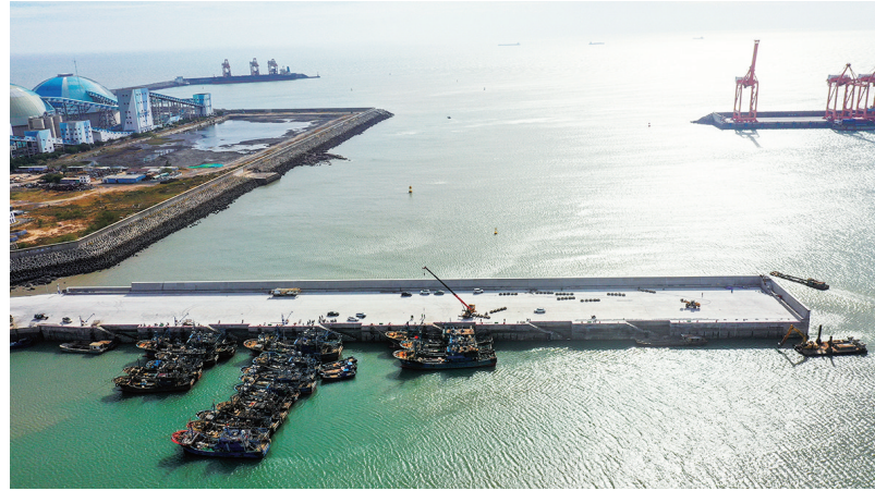
11月27日,石狮市锦尚东店一级渔港工程建设传来好消息,整个工程水工主体结构及预验收工作已经完成,将于12月交工验收。石狮市锦尚东店一级渔港工程设计年卸港量为4.25万吨,主要建设北防波堤兼码头315米、南码头200米、南引堤196米,改造北引堤353米;形成港内水域面积73万平方米,并配套建设水电设施。(记者 洪菲菲 黄晓东 颜华杰)

●近日,由福建省民政厅、人力资源和社会保障厅、总工会、妇女联合会主办的2025年福建省养老护理职业技能大赛在福州落下帷幕。来自石狮市宝盖镇永康长者照护中心的黄禄资代表泉州参赛,荣获一等奖。(记者 林本鸣)