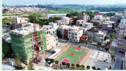
鸿山镇湖厝村老人活动中心项目历经4个多月紧张施工,近日顺利封顶。项目即将进入装修与设备配置阶段,预计明年上半年可投入使用。(记者 王国良 郭雅霞)