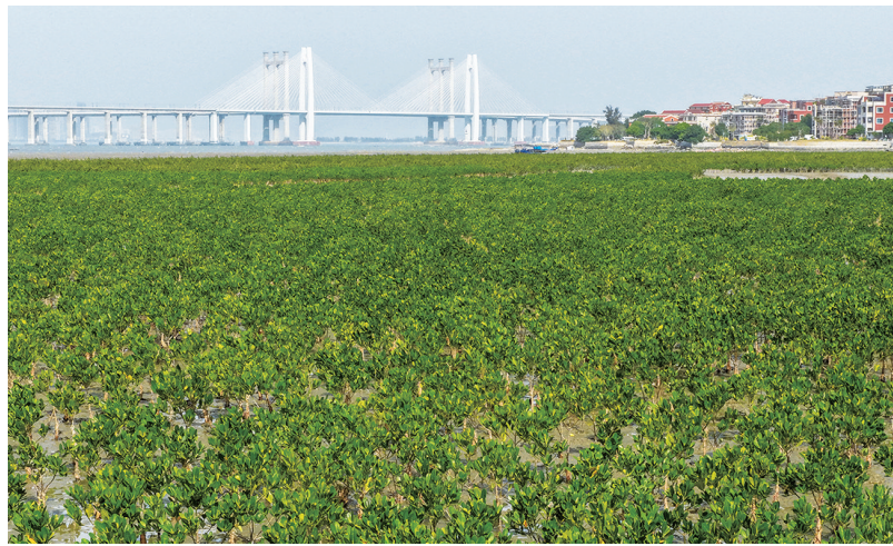
冬日的泉州湾畔,石狮蚶江石湖海岸的滩涂上,连片红树林枝叶繁茂,绿意盎然,从“一片草”到“一片林”,这是石狮海岸生态修复的生动注脚。2022年7月以来,石狮市在泉州湾沿线5个县(市、区)中率先启动互花米草除治工程项目,在此基础上,2023年11月和2025年5月,石狮在石湖海岸分两批人工补植约300亩红树林。如今,这片红树林长势良好、生机勃勃,成为泉州湾南岸的“生态屏障”。(记者 林恩炳 颜华杰)