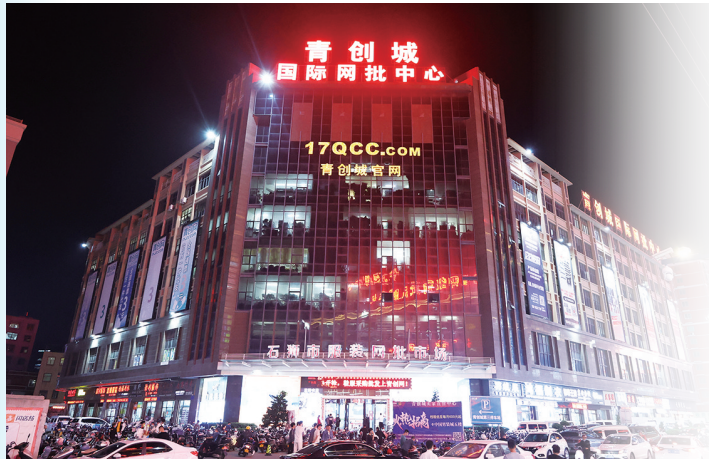
青创城国际网批中心是“石狮电商谷”活力的写照