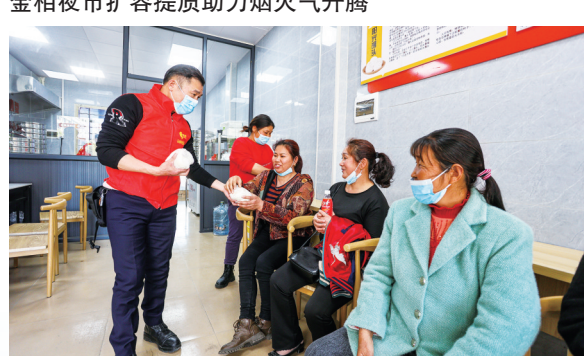
“永恒阳光馒头店”通过“以商养善”在灵秀重启