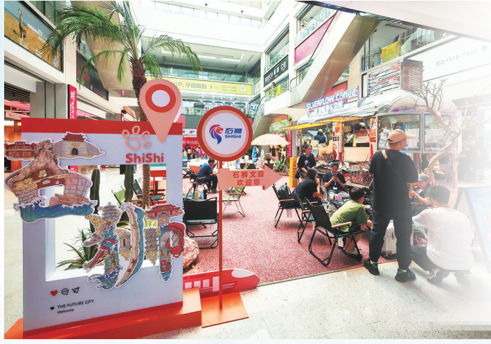
好莱铎创意街区拉开了服装城业态升级的帷幕