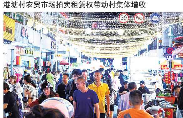
金相夜市扩容提质助力烟火气升腾