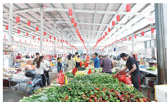
港塘村农贸市场拍卖租赁权带动村集体增收