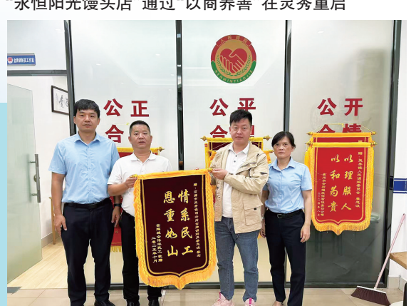
灵秀镇综治中心为群众提供纠纷调解等“一站式”服务