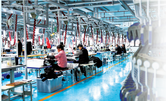
益德服装制造公司积极“智转数改”提升发展质效