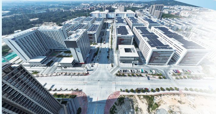
石狮网商园完成招商成为灵秀增长新引擎