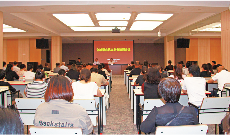
构建全域覆盖、上下联动的帮办代办政务服务体系