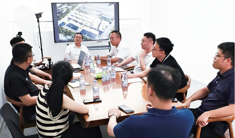
组建审批服务“轻骑兵”团队，深入项目一线解难题