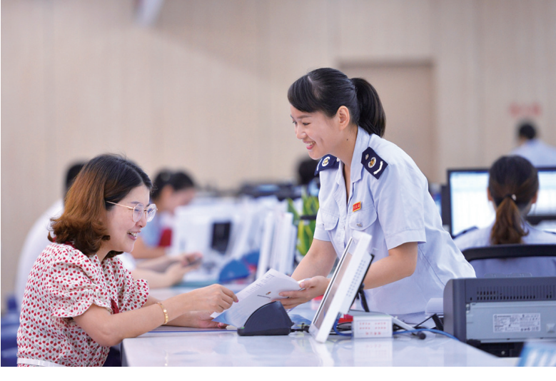
实行“一窗式受理、一站式审批、一条龙服务”的运行模式