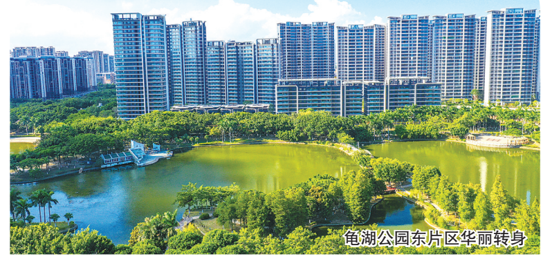
龟湖公园东片区华丽转身

同步进行的热闹场景。 “十四五”期间,宝盖镇坚持项目带动,着力推动“焕新颜、畅脉络、靓边角”一系列“抓城建提品质”的项目落地,“城市新中心”建设提速提质。除了先后铺开五个片区更新外,该镇还打通了九二东路、金盛路等“断头路”,建成府园路等新通道;大力推进人居环境整治行动,对交通干道沿线的闲置地、卫生死角进行清理整治,并建起10多个口袋公园;完成塘头沟、后宅沟、西洋沟等十余段内沟河整治。 五年奋力攻坚,宝盖镇的面貌日新月异,为即将到来的“十五五”打开新的局面。