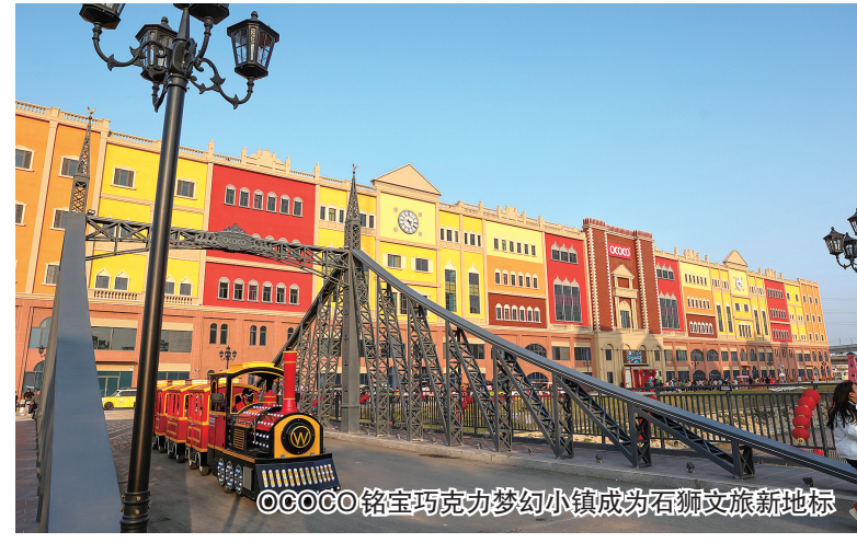
OCOCO铭宝巧克力梦幻小镇成为石狮文旅新地标

率先推行“镇党组织—村级党组织—小区党组织”三级联动管理机制。在小区物业管理提升行动中,“宝盖经验”更是广受关注,并屡获各级肯定。其中,百德康桥假日小区建立“小公维金”机制的创新做法被《人民日报》、新华社等央媒关注;“大物业”模式破解安置小区物管难题、业主和物业“双向奔赴”良性循环等方面的好做法被泉州推广。2023年9月,泉州物业服务质量星级评定工作率先在宝盖试点。 近年来,宝盖镇还创新性探索园区“业委会”新模式,引导鞋城企业自发成立鞋城发展促进会;推出“零工市场”服务项目,上线“宝盖职聘”小程序,打通就业服务“最后一米”;等等。 五年探索不止,基层治理的“宝盖样本”不断迭代升级,温馨、和谐、文明、幸福家园的成色更足。