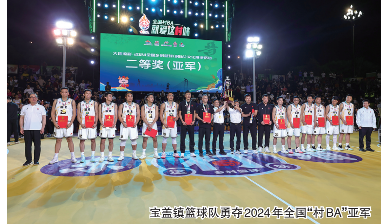
宝盖镇篮球队勇夺2024年全国“村BA”亚军