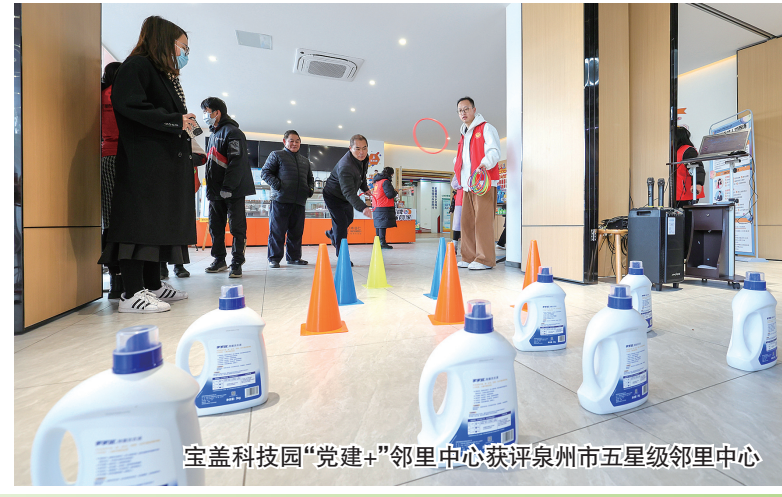
宝盖科技园“党建+”邻里中心获评泉州市五星级邻里中心

间,宝盖镇文体事业取得十分耀眼的成绩。2021年7月,“泉州:宋元中国的世界海洋商贸中心”申遗成功,宝盖山上的万寿塔(姑嫂塔)有了新“头衔”——世界遗产点。五年来,宝盖镇“村BA”创造了历史新纪录。2024年,该镇篮球队先后夺得全省“村BA”冠军和全国“村BA”亚军。2025年,宝盖镇篮球盛事连连——成立全市首个镇级篮球协会,成功举办第十届宝盖镇“村BA”、承办“泉BA”,获得全省“村BA”亚军。五年来,宝盖镇大力发展群众性文化体育活动,打造新的文体活动品牌。 五年用心作答民生答卷,让群众共享发展红利,获得感、幸福感、安全感不断增强。