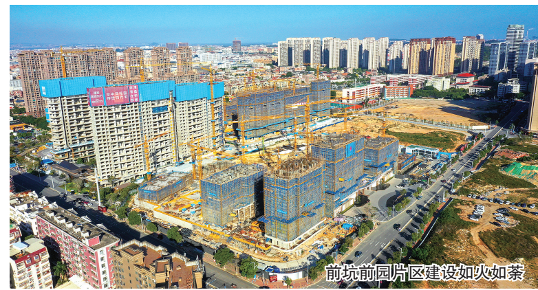
前坑前园片区建设如火如荼

载体。 在推动产业转型升级上下功夫。大力培育新质生产力,鼓励企业加速“智改数转”,一大批实验室、技术中心、5G智能车间相继投用。如引进高新技术企业苏州博理新材料科技有限公司,与卡宾公司合作打造首条4D打印项目;冠豪体育产业园投建实验室,研发复合材料制品;益盛化纤打造5G智能车间与泉州市级企业技术中心……截至2025年10月,全镇“规上规下”企业达163家,国家、省级高新技术企业增至49家,战略性新兴产业增至9家,省级专精特新企业增至4家。 五年全链赋能,一个个产业项目落户宝盖,一条条智能生产线相继建成投产,这片热土不断迸发出新动能。