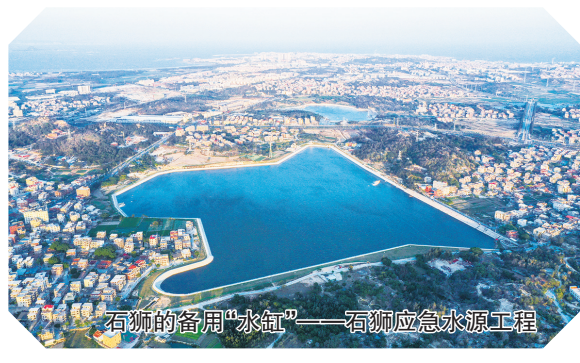
石狮的备用“水缸”——石狮应急水源工程