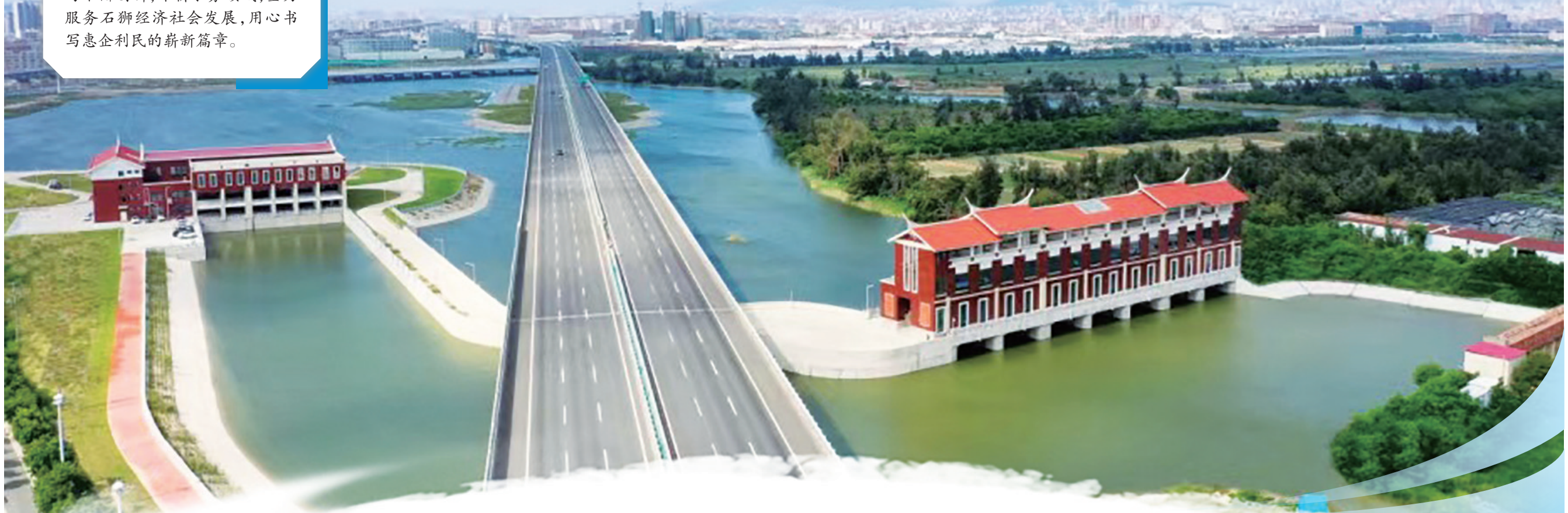
石狮的“小三峡”工程——石狮市水头防洪排涝枢纽工程

在城市肌理之下，水脉犹如隐秘而强大的经络，串联起生活的每一个角落，滋养城市生长与繁荣。水，不仅是生命的基础，更是城市发展的核心要素。福建石狮水务投资发展有限公司作为城市水脉的守护者与开拓者，“十四五”以来，以深邃洞察、无畏担当与不懈创新，深耕水务领域，全力服务石狮经济社会发展，用心书写惠企利民的崭新篇章。