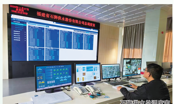
石狮供水总调度室