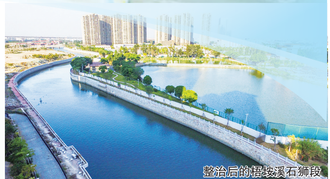
整治后的梧垵溪石狮段

数字化转型是石狮水投“十四五”期间的亮点。公司引进智慧水务管理理念，打造“水厂—管网—用户端”一体化管控平台，实现从监控到管理的全流程智能化。物联网感知平台如同水务系统的“神经末梢”，实时监测水质、水压、流量等数据，通过大数据分析预警管网漏损、优化调度方案。线上营业厅和微信服务平台让用户动动手指就能完成缴费、报装、投诉等业务，真正实现“掌上办、网上办、及时办”。智慧水务不仅提升了运营效率，降低了产销差率，更让水资源管理变得精准而高效。在工程建设中，水头排涝枢纽工程荣获“2023年福建省水利科学技术奖”一等奖、2023年度福建省“闽水杯”水利优质工程（金奖），这项工程有效解决了城市内涝问题，提升了防洪抗灾能力，为经济发展营造了安全环境。加快推进市政排水管网溯源排查工作，完成溯源排查管网长度1400多公里，基本建成智慧水务“一张图”系统，为全市水环境系统整治提供数据支撑。