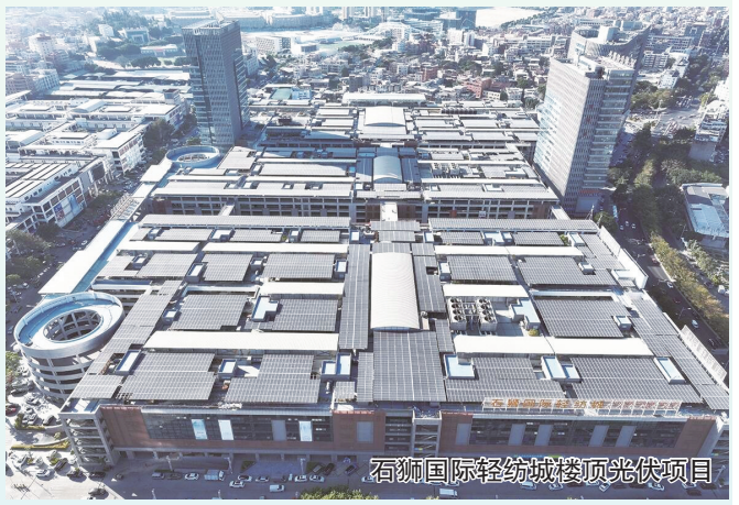
石狮国际轻纺城楼顶光伏项目

营商环境，“水”处可见。石狮水投深知，优质高效的水务服务是优化营商环境的重要组成部分。石狮水投始终秉持“水润狮城，心泽万家”的理念，将服务民生作为重中之重。“十四五”以来，公司推出一系列便民惠企举措，打造一流营商环境。在便民服务方面，公司深化“放管服”改革，纵深推进“一趟不用跑，最多跑一次”改革，开展营商环境“获得用水”标准化建设，推行用水报装“一站式”服务和“帮办制”服务模式，开通“居民不动产转移登记与水电气户联动过户”绿色通道，实施用水报装“三省”“两压”“一优”“零材料、零费用、零跑腿”的“3210”用水服务新模式，把“主动服务、靠前服务、精准服务”落到实处。全市缴费网点近300个，24小时服务热线随时响应需求。二次供水改造工程惠及71个小区近1.5万户居民，让群众喝上“优质水”“明白水”。