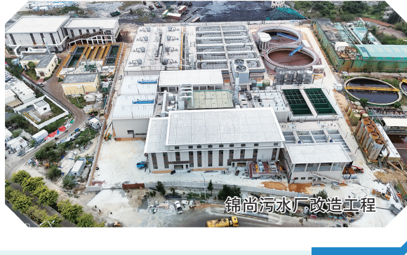
锦尚污水厂改造工程