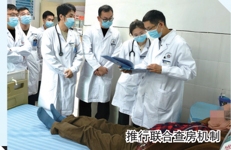
推行联合查房机制

科室先后获评PCCM优秀单位、社区高血压管理示范中心、慢阻肺防治融合案例多次在国家、省级学术会议上交流推广，并参与全国《基本公共卫生服务慢阻肺病基层管理者实践手册》编写。