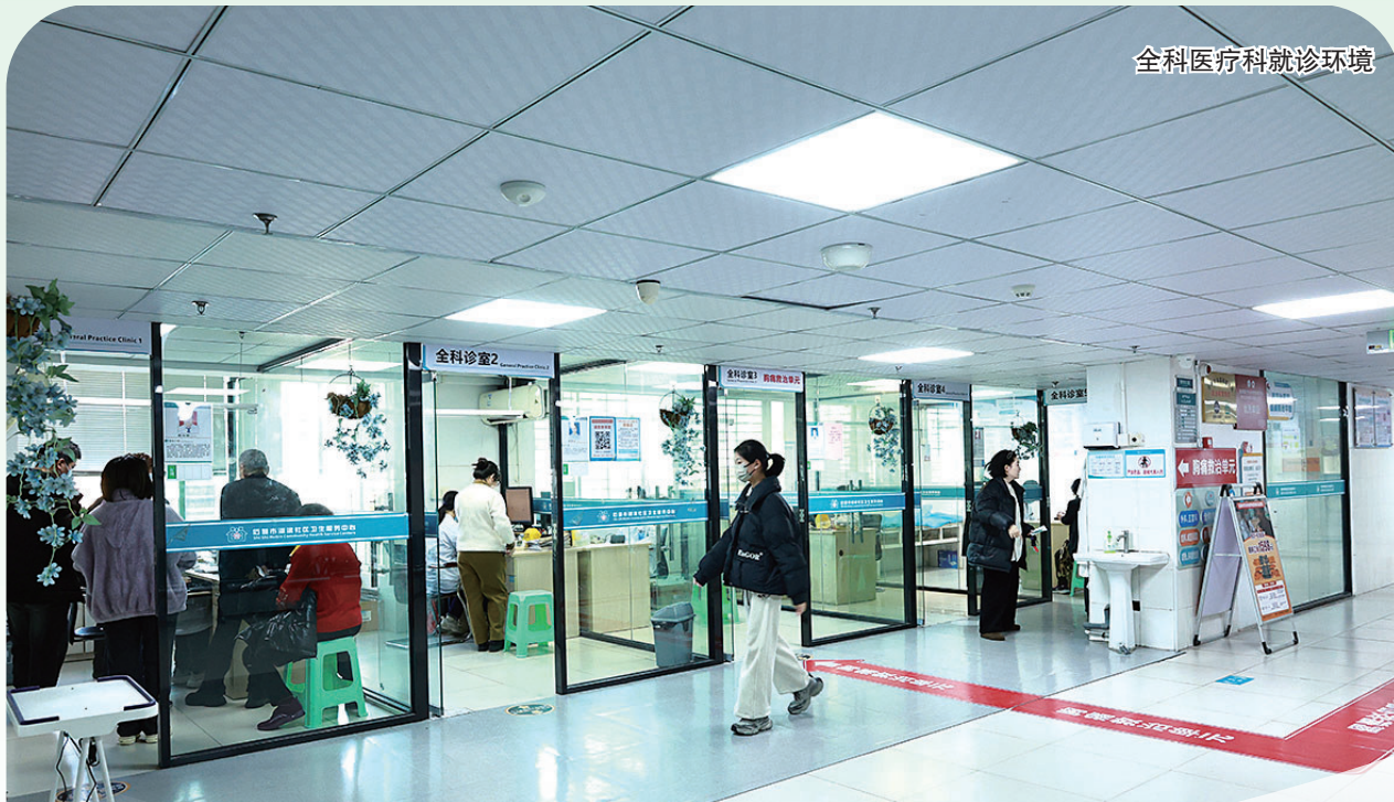
全科医疗科就诊环境