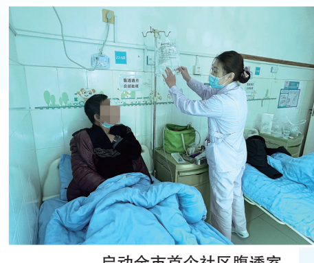
启动全市首个社区腹透室

十年来，全科医疗科以技术革新驱动服务升级，推动基层诊疗从“粗放”走向“精准”。科室累计引进肺功能检测、24小时动态心电图监测、动态血糖监测、动态血压监测、体表诱发电位监测、呼吸睡眠监测等10余项先进设备，开展新技术服务3000余例，极大提升基层疾病的早期筛查与精准诊疗能力，如，24小时动态心电图监测可捕捉隐匿性心律失常，体表诱发电位监测则可用于糖尿病并发症的筛查。