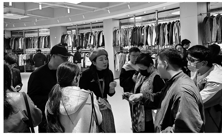
采购商在石狮产业带走访,深入了解企业生产、销售于一体的出口型企业,产品远销欧洲、南美等地区,同时搭建了国内外主流平台的电商供货体系,其高效的定制服务和成熟的产业链条,让客商们频频驻足,纷纷拿起样品,围绕合作起运量和交付周期等细节深入交流。

本报讯 12月19日,2025泉州跨境电商供应链焕新大会进入第二天议程。为让全球客商深度感受泉州产业硬核实力,大会特设“走访产业带”实地对接环节,近30家展会采购商组团走进石狮,深入产业一线开展参访洽谈,沉浸式体验我市跨境电商全链路生态。