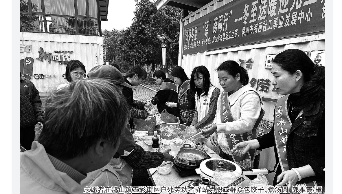
志愿者在鸿山镇五彩街区户外劳动者驿站为职工群众包饺子、煮汤圆。

地点:凤里街道 本报讯 12月19日,在石狮市妇联的指导下,凤里街道妇联联合“咱厝边”家庭服务中心、东村社区居委会、儿童之家等单位,于东村社区长者食堂开展“温暖冬至 情暖人心”冬至主题活动,吸引60余名辖区居民踊跃参与。活动现场,妇联执委开场致辞,向到场居民致以节日问候。随后,致和社工通过图文并茂的PPT,细致讲解冬至起源与闽南地区独特民俗,还穿插“糊圆仔”“红白圆寓意”“喜鹊丸”等趣味知识问答,以互动形式加深居民对传统节日的认知。在搓圆环节,老人与孩子