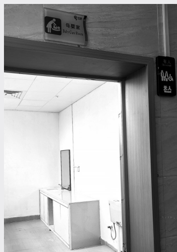
市人民广场公厕新增“母婴室”