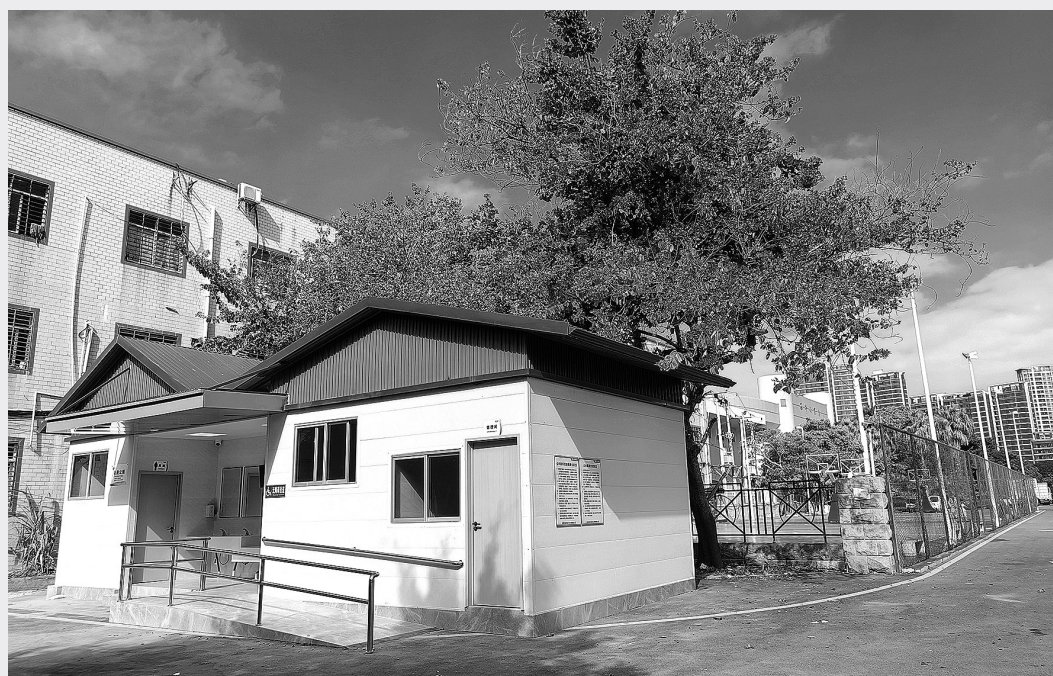
市体育馆公厕焕然一新

本报讯 作为2025年石狮市“为民办实事”重点项目之一，我市4座公厕智能化改造提升工程目前已全面竣工，陆续投入使用。记者从石狮市城管执法局获悉，项目在科学规划、精准满足群众“基础需求”的同时，积极融合技术创新，向“智慧服务”升级迈进，切实提升市民如厕体验。 据了解，此次改造（新建）的4座公厕分别位于市人民广场、镇中路、市体育馆及黄金海岸洛伽寺等人员密集区域。其中，人民广场、镇中路和体育馆原有公厕因设备老化破损、功能配置不足等问题，难以满足群众需求。另外，随着洛伽寺旅游热度持续攀升，市民游客对便捷舒适公厕的需求也日益迫切。 民有所呼，政有所应。市城管执法局在实地调研并广泛听取群众意见基础上，组织专业团队精心设计，于今年10月份同步启动4座公厕的改造与新建工作。经过近三个月的紧张施工，如今4座公厕焕然一新，以更智能、更人性化的面貌服务市民游客。 具体来看，市人民广场公厕（市政府小停车场旁）完成外立面招牌翻新、室内吊顶及厕位隔断更新，并新增“母婴室”，玻璃加装隐私膜；镇中路公厕（八卦街施琅坊旁）同步实施室内外翻新并增设“母婴室”；市体育馆公厕采用装配式设计，新建50平方米现代化公厕，配备“第三卫生间”，整体采用原木风格与坡屋顶造型，与周边环境协调统一；新建的洛伽寺公厕则以仿古红砖墙体搭配铝镁合金橘红屋顶，呼应寺庙红黄主色调，实现古建新韵的视觉融合。 值得一提的是，上述4座公厕均深度融合智能化系统：入口处设置智慧显示屏，实时显示“剩余蹲位”、客流量、温湿度及氨气、硫化氢浓度等环境数据；配备自动皂液器、免费扫码