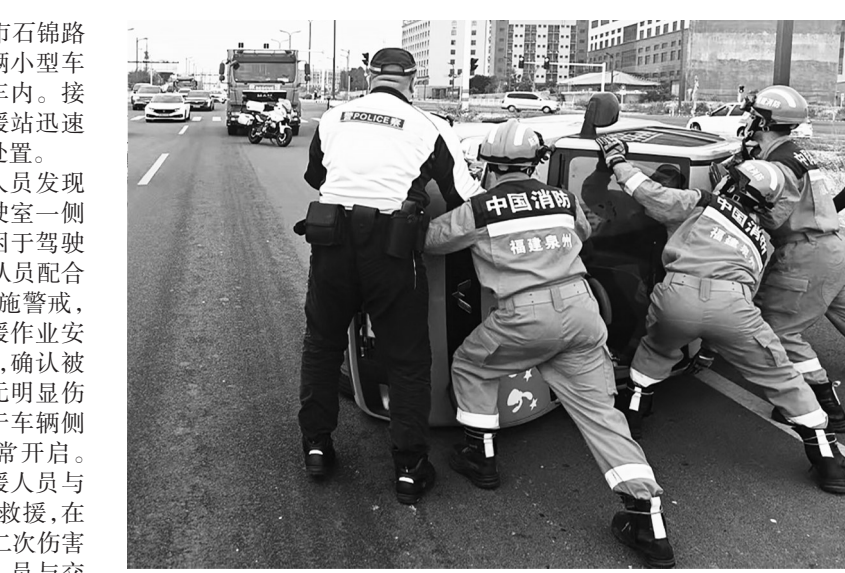
顺利打开驾驶室车门，被困人员救出。经现场初步检查，该人员除受到惊吓外，身体并无大碍。（记者 洪诗桂 通讯员 邱焯琦）

本报讯 近日，石狮市石锦路发生一起交通事故，一辆小型车发生侧翻，有人员被困车内。接到报警后，消防消防救援站迅速派出救援人员赶赴现场处置。 到场后，消防救援人员发现事故车辆发生侧翻，驾驶室一侧紧贴地面，一名人员被困于驾驶室内。指挥员迅速安排队员配合现场交警对事故区域实施警戒，疏导过往车辆，确保救援作业安全。经初步勘查和询问，确认被困人员意识清醒，无明显生命危险，暂无生命危险。由于车辆侧翻，副驾驶车门也无法正常开启。鉴于现场情况，消防救援人员与交警立即制定方案开展救援，在确保不对被困人员造成二次伤害的前提下，由消防救援人员与交警协同，利用人力及辅助工具，小心翼翼地将侧翻车辆扶正，随后