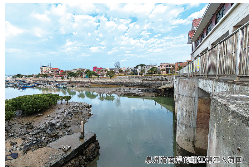
泉州湾南岸的蚶江锦江入海口

本报讯 隆冬时节,海风凛冽。1月5日,记者在位于泉州湾南岸的蚶江镇锦江入海口看到,白鹭飞翔、渔舟唱晚,一湾清水入海流。记者从石狮市环委办获悉,截至2025年12月底,全市纳入整治范围的100个入海排污口、29条列入“除黑”“消劣”任务的入海沟渠全部完成整治任务。