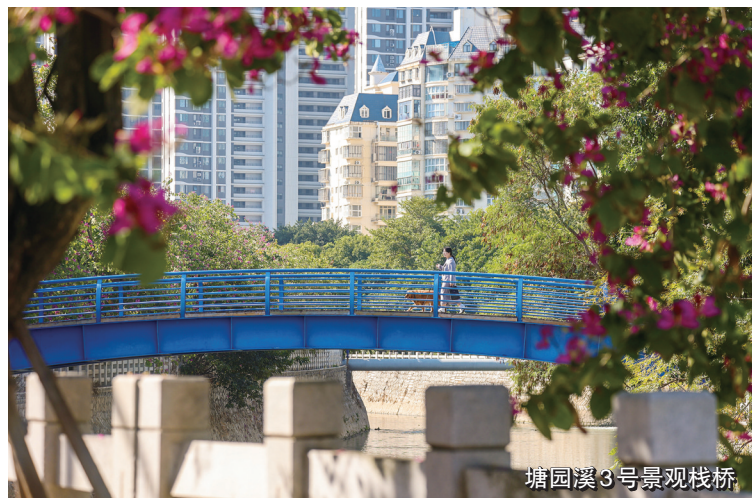
塘园溪3号景观栈桥