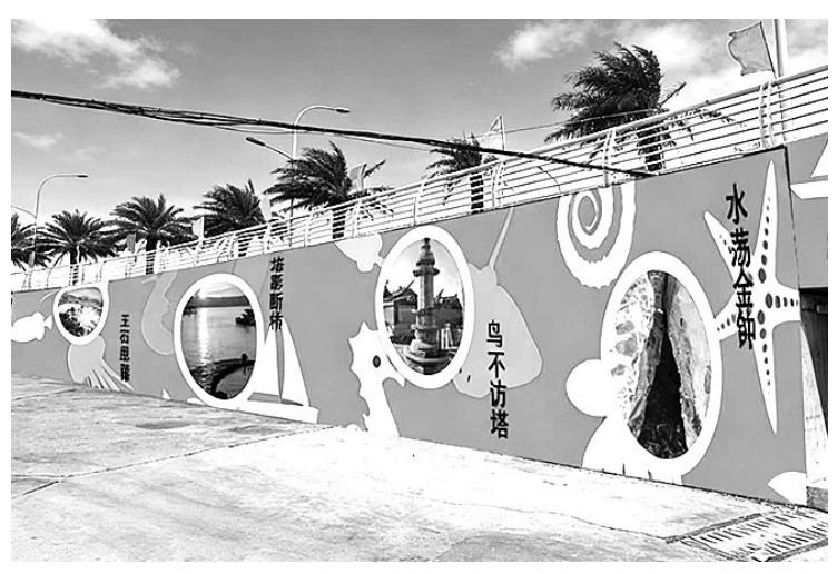
本报讯“鸟不访塔”“水荡金钟”“玉石露”“塔影断桥”……1月12日，记者在蚶江镇锦江村看到，一幅幅描绘“蚶江八景”的生动

为该村滨海景观带与文化产业融合项目首个亮相的亮点。据悉，“美丽渔村彩绘”作为石狮市蚶江镇锦江村滨海景观带与文化产业融合项目重要组成部分，重点对总面积1200平方米的锦江外线渡头尾隧道及旁边墙体进行统一风格设计，巧妙融入蚶江八景、渔民作业、渔村风貌等文化元素，旨在打造辨识度强的乡村品牌视觉形象。