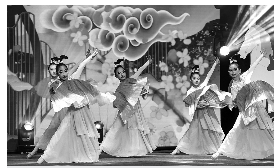
海百合艺术专场精彩上演 欢乐海百合 艺彩耀新春

组成慰问小组，深入儿童家中走访。慰问组为孩子们送上定制的“希望之光”爱心礼包，礼包内有学习文具、生活用品等实用物资，精准对接孩子们的日常需求，切实解决实际困难。收到礼物的孩子们脸上洋溢着幸福笑容，纷纷表达感谢：“谢谢阿姨们来看我，这些礼物我很喜欢，以后我会更努力学习，不辜负大家的关心。”