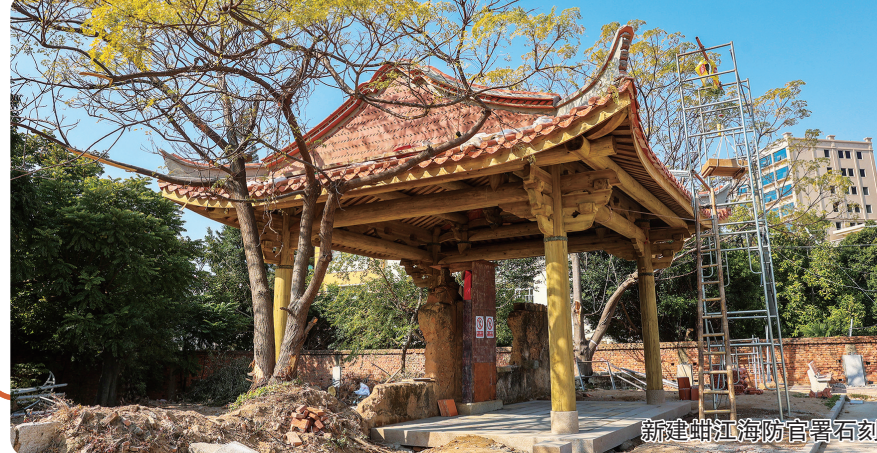
新建蚶江海防官署石刻