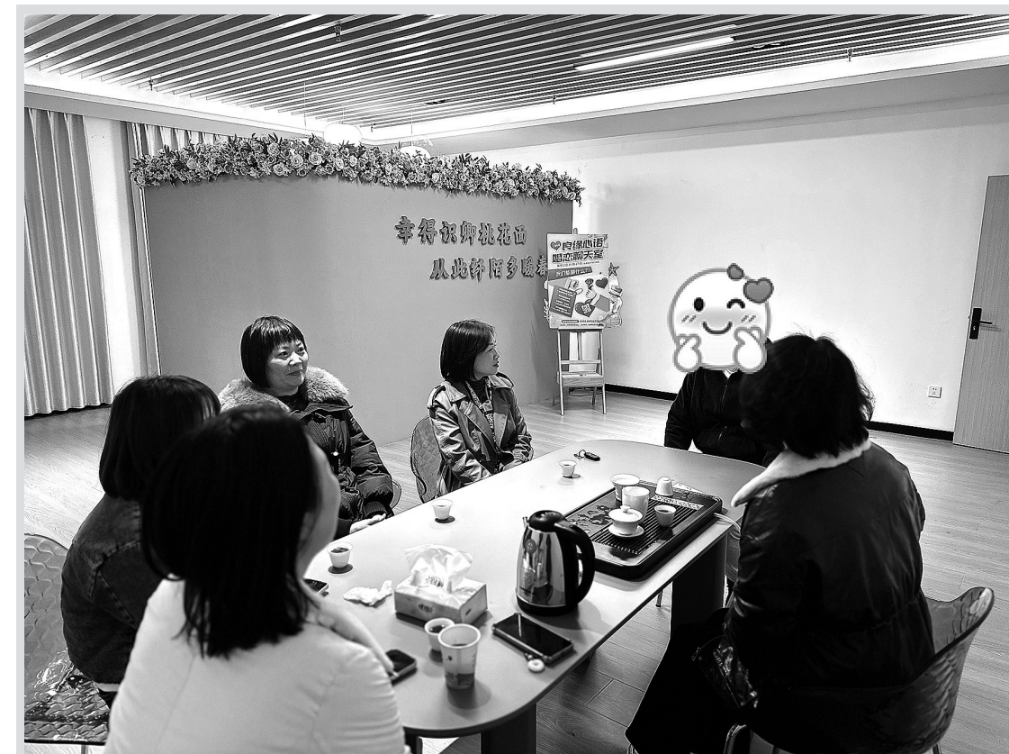
全力服务单身青年婚恋需求

比赛中,选手们展现了高超的竞技水平与良好的体育道德。赛场上,发球精准、吊球巧妙、扣杀有力;赛场下,互相鼓励、交流技艺、增进情谊。经过激烈角逐,各组别名次相继产生。赛事组委会为各小组别前八名选手颁发奖牌及证书。(记者 许小雄)