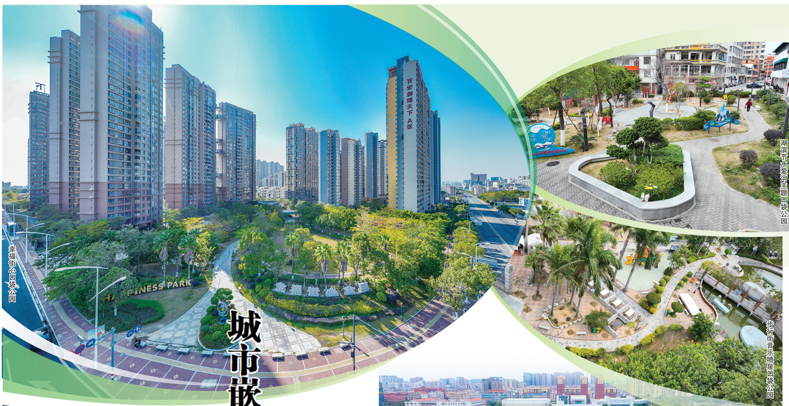
幸福街心口袋公园