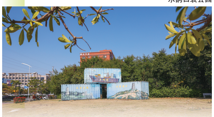
港口大道与香江路交叉口袋公园