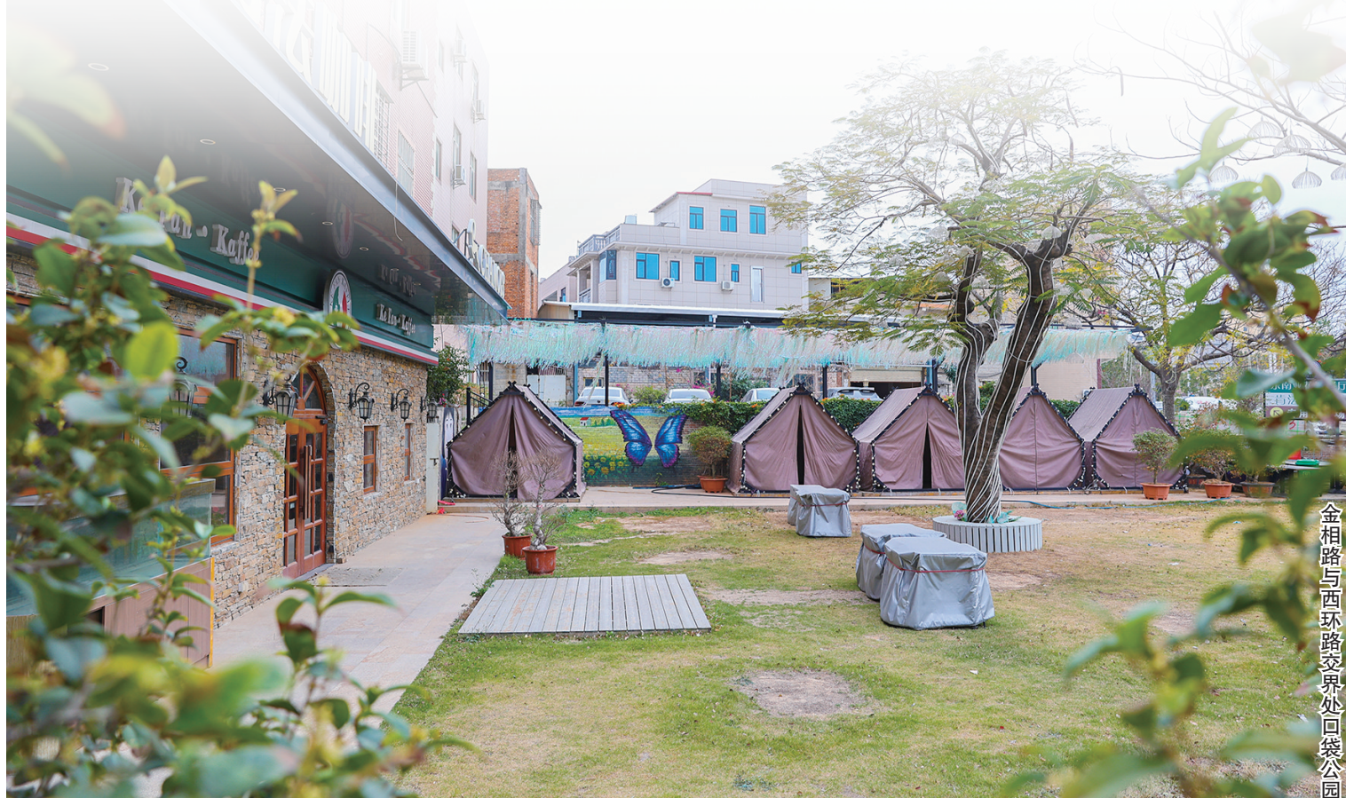
金相路与西环路交界处口袋公园