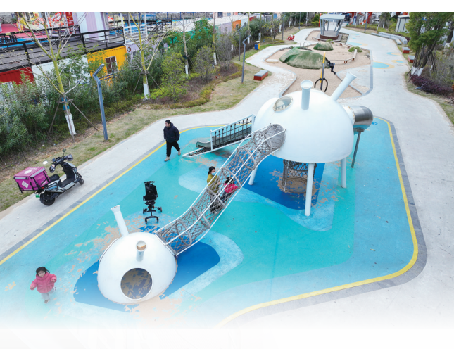
石龙路运动休闲口袋公园