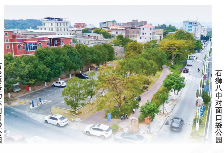
石狮八中对面口袋公园