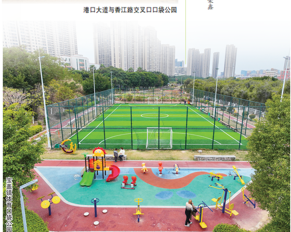
宝盖镇体育高口袋公园