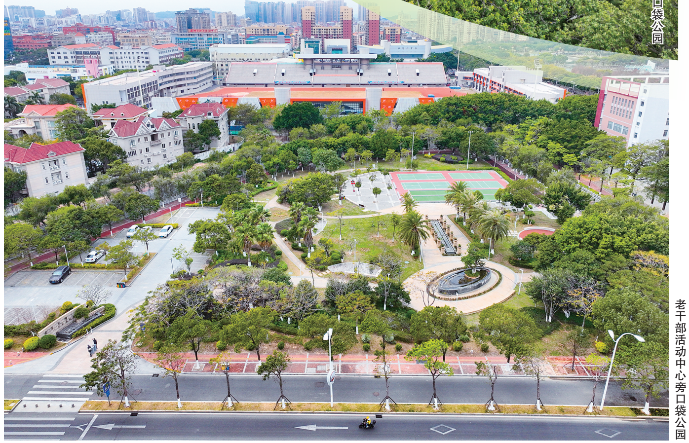
老干部活动中心旁口袋公园