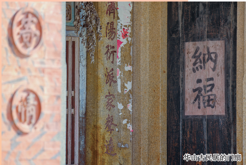
华山古民居的门楣