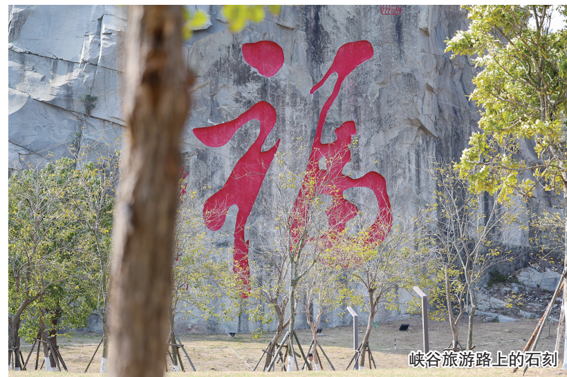
峡谷旅游路上的石刻