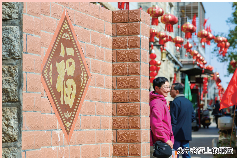
永宁老街上的照壁