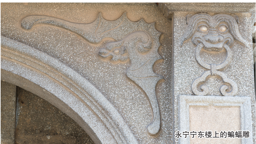
永宁东楼上的蝙蝠雕