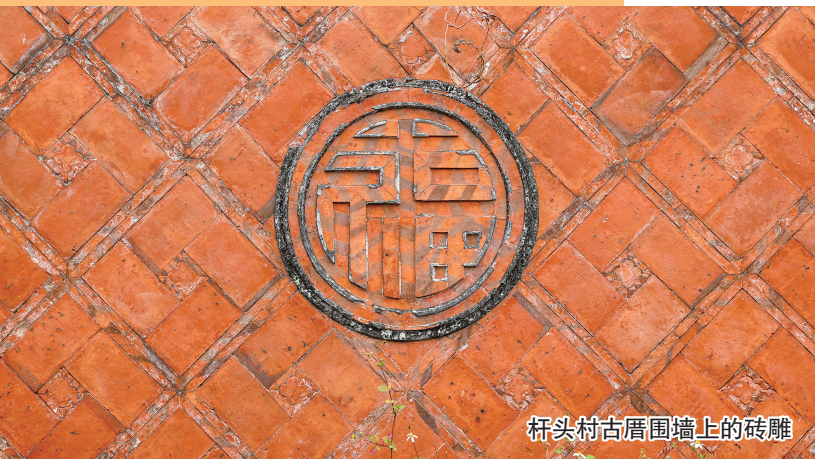
杆头村古厝围墙上的砖雕