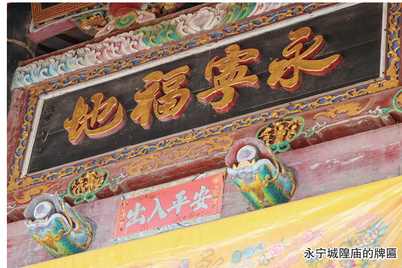
永宁城隍庙的牌匾