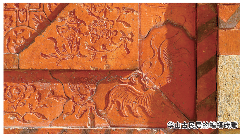
华山古民居的蝙蝠砖雕