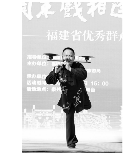
“周末戏相逢·大地情深”福建省优秀群众文艺作品巡演(泉州站)在泉州府文庙广场上演。本场巡演汇集全省各地优秀群众文艺作品，涵盖南音、舞蹈、武术、高甲戏等多元艺术门类，来自我市的传统非遗技艺节目《璇钹九霄》惊艳亮相古城舞台，为本场省级群众文艺惠民活动增添浓郁的本土非遗韵味。

此次《璇钹九霄》亮相省巡演舞台，不仅让更多人领略到我市非遗技艺的风采，也推动了闽南非遗的传播与传承，为省级群众文艺交流平台注入鲜活的石狮力量。(记者 王文豪)