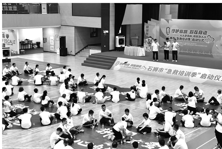
石狮启动“急救培训季”行动,推动急救力量向民间拓展

他提醒,当遇到身边有人倒地时,牢记这些步骤可以救命:首先确认现场环境是否安全,随后轻轻拍打患者肩膀并呼唤,观察其是否有反应,并通过摸颈动脉、探鼻息等方式检查是否有呼吸和心跳。如果确认患者心跳停止,应立即启动急救程序,拨打120并清