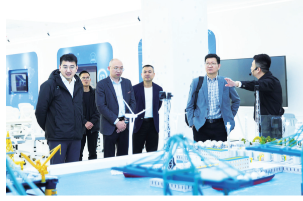
清华大学课题组在石狮高新区调研人工智能+应用，与园区工作人员交流。

设施配置,提升算力资源利用效率。同时统筹建设园区统一数字平台,探索建设可信数据空间,释放数据要素价值。 为确保建设工作落地见效,石狮高新区已成立高标准数字园区建设运营领导小组,建立统筹实施、专班推进工作机制,将数字化基建、企业数字化服务、政务数字化三大板块任务细化分解、责任到人,全程跟踪推进、闭环管理。接下来,园区将持续聚焦三大核心板块,以更大力度、更实举措推进数字化建设,全力打造区域数字化转型标杆样板,力争率先跻身全国高标准数字园区首批示范试点行列。 (记者 尼松义 通讯员 孙金棍)