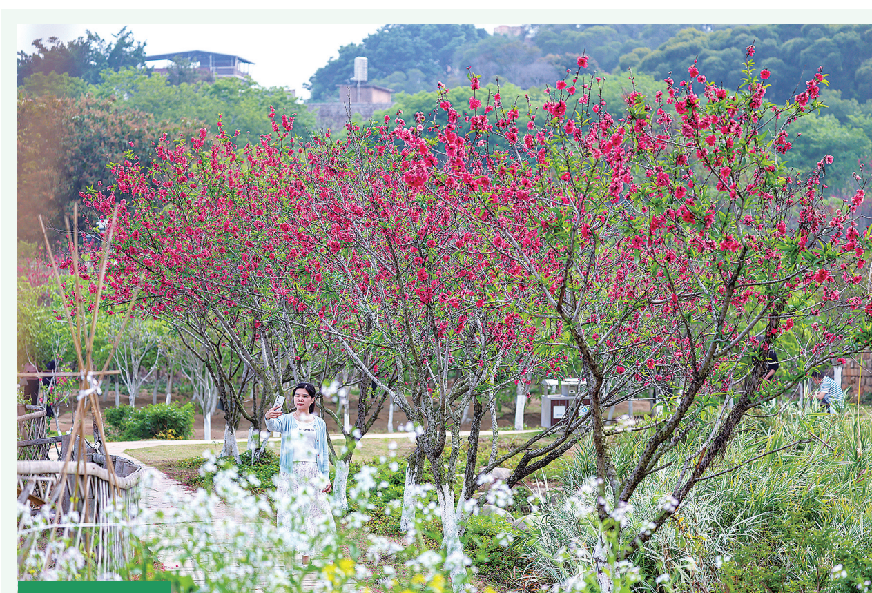
春和景明 不负花期

在申报方式上,设计服务外包奖励项目、工业设计奖项奖励项目、工业设计大赛奖励项目、大学生设计工作坊(设计营)奖励项目、仓配一体化补助项目采取网上申报方式,申报单位从“泉州市惠企政策线上直达兑现平台”进行注册、填报、提交,申报截止时间为5月8日,逾期系统自动关闭。工业设计中心采取纸质申报方式,申报单位于4月28日前将纸质申报材料报送至石狮市工业和信息化科技局。(记者 周进文)