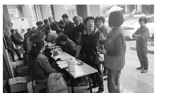
东埔二村开展免费健康体检活动。

3月31日至4月1日，东埔二村联合鸿山卫生院，为65岁以上的老年人和35岁以上的高血压、糖尿病患者开展免费健康体检活动。