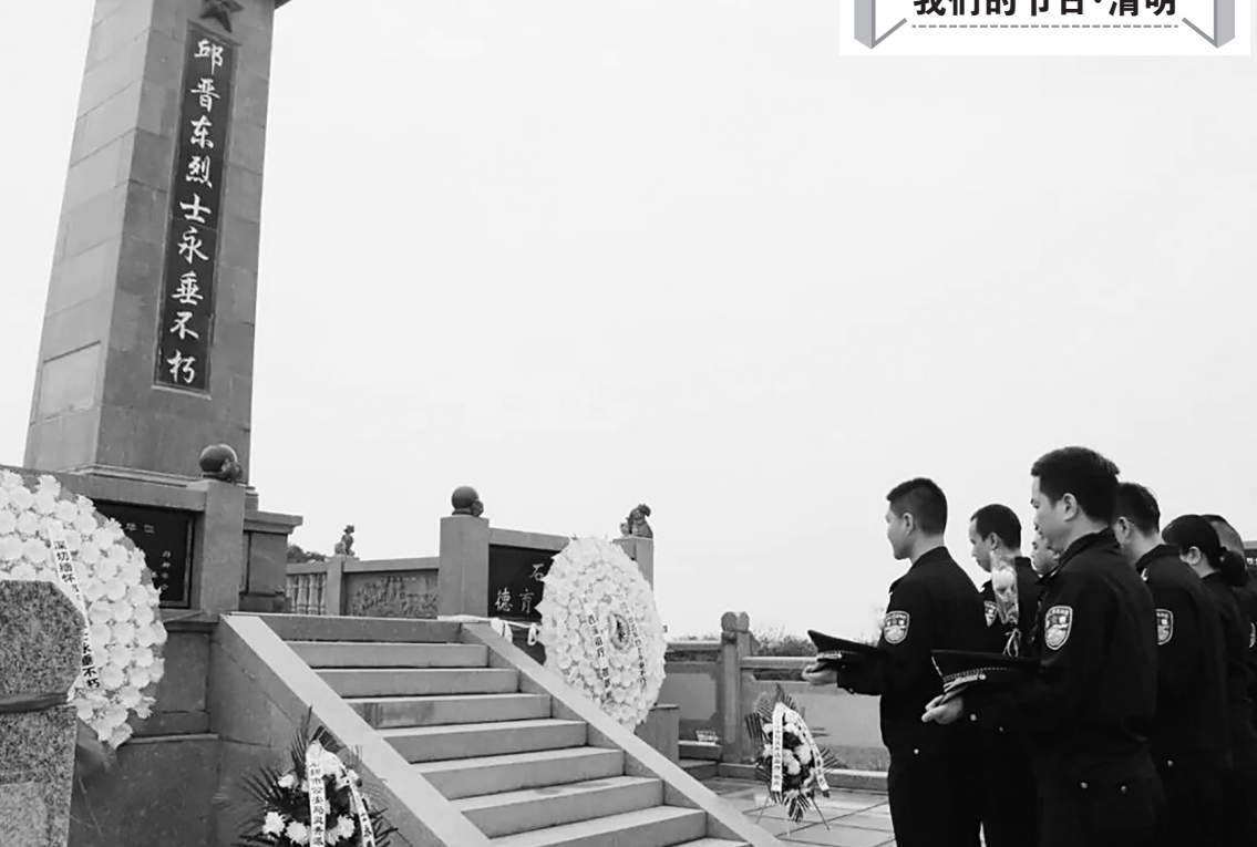
石狮市烈士陵园祭扫现场。

清明期间，石狮市各公墓祭扫人流如织，但园区内外秩序井然。现场，市民、公安、卫健、消防等相关职能部门工作人员加强值班值守、协调联动，全力应对祭扫高峰、做好应急准备，确保群众度过一个平安、文明、祥和的清明节。