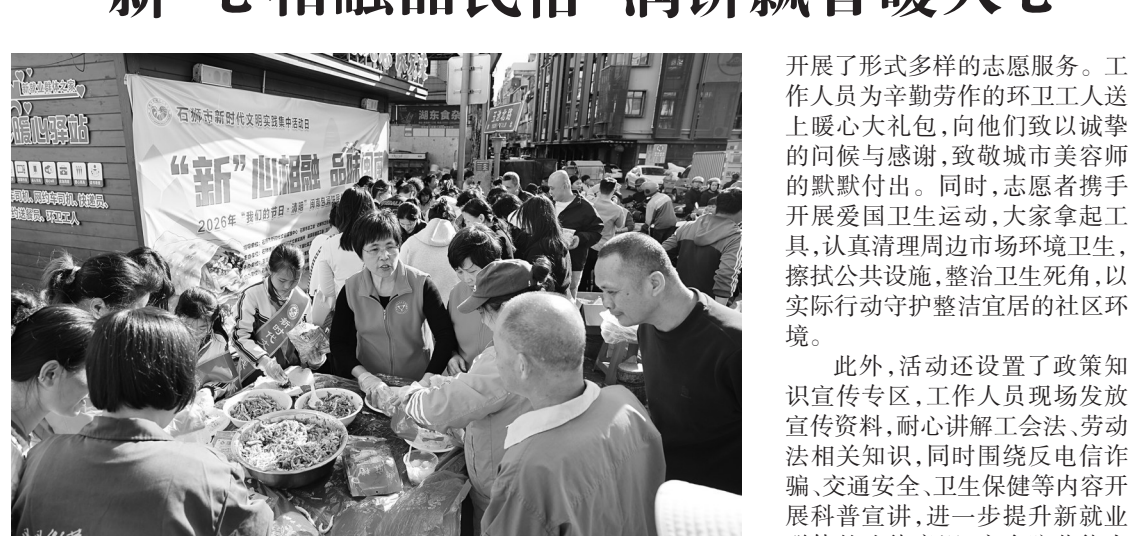
玉湖社区开展清明节民俗体验志愿服务活动。

4月1日，在石狮市总工会、市卫生健康局的指导下，湖滨街道玉湖社区工会联合会联合石狮市融媒体中心、石狮市计划生育协会、石狮市疾病预防控制中心等多家单位，在玉湖社区新就业群体之家暖心驿站，开展“新”心相融 品味闽南”清明节闽南包润饼民俗体验志愿服务活动。