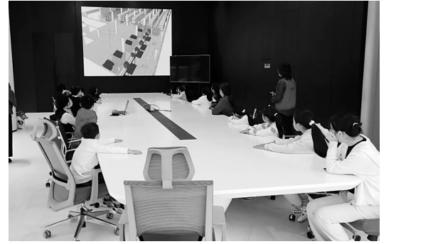
卡宾品牌亲子家庭走进卡宾总部。

近日，在石狮市妇联指导下，宝盖镇妇联、宝盖镇妇联“咱厝边”家庭服务中心、石狮市致和社工事务所联合卡宾服饰(中国)有限公司，开展“走进卡宾探匠心·亲子同行感恩亲”“三新探趣”亲子研学活动，开启一场匠心探索之旅。