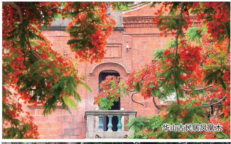
华山古民居凤凰木