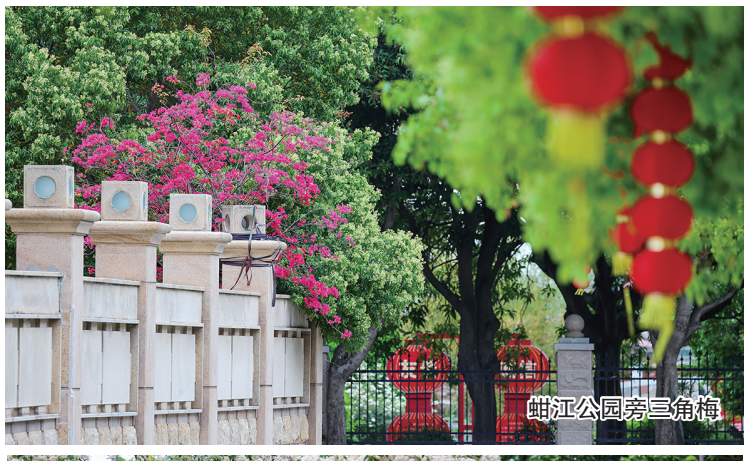
蚶江公园第三角梅