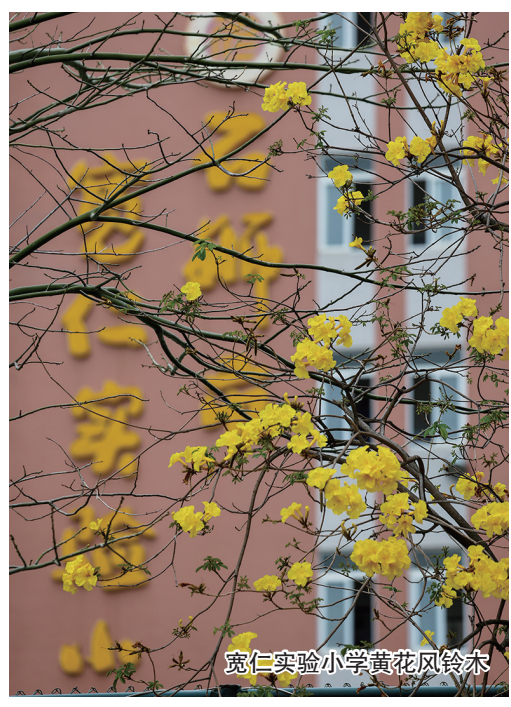
宽仁实验小学黄花风铃木