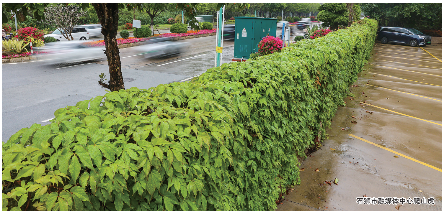
石狮市融媒体中心爬山虎