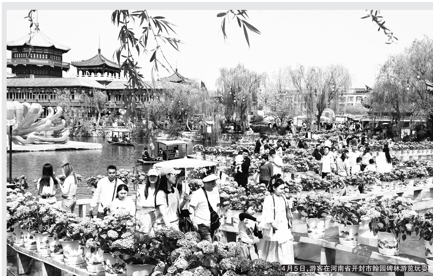
4月5日,游客在河南省开封市翰园碑林游览玩耍

“我们敦促日方深刻反省军国主义侵略历史,在军事安全领域恪守承诺,慎重行事,不要在错误的道路上越走越远。”她说。