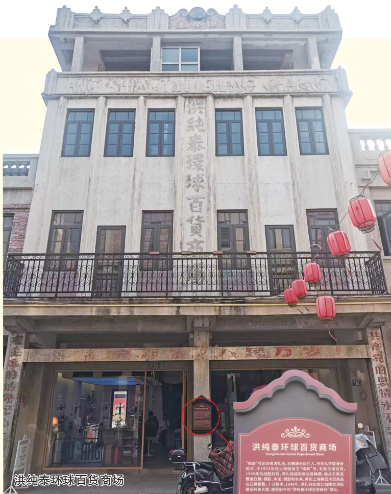
洪纯泰环球百货商场