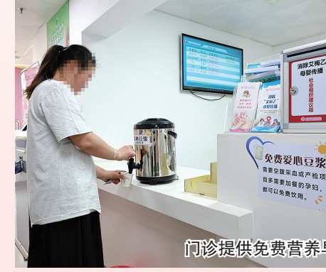
门诊提供免费营养早餐

细节之处更见温度,门诊还贴心提供免费营养早餐,避免孕妇因空腹检查出现低血糖等问题。