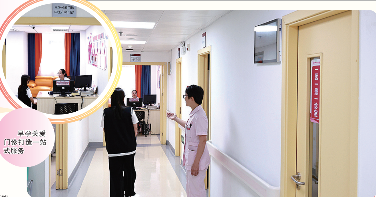
早孕关爱门诊打造一站式服务

而早在一年前,石狮市妇幼保健院已率先在泉州县级妇幼机构中开设早孕关爱门诊,打造“一站式”布局,推出“三师共管”服务,构建“多学科诊疗”体系,为孕早期女性筑起全周期、精细化的健康屏障,成为政策落地前的先行样本。