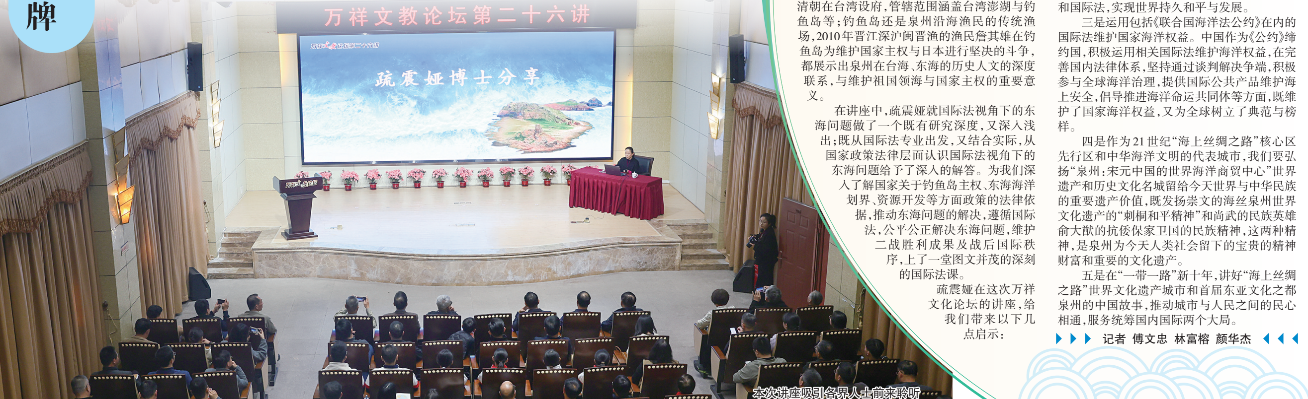
本次讲座吸引各界人士前来聆听