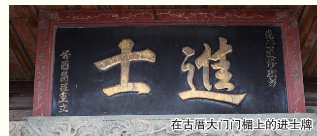
在古厝大门门楣上的进士牌