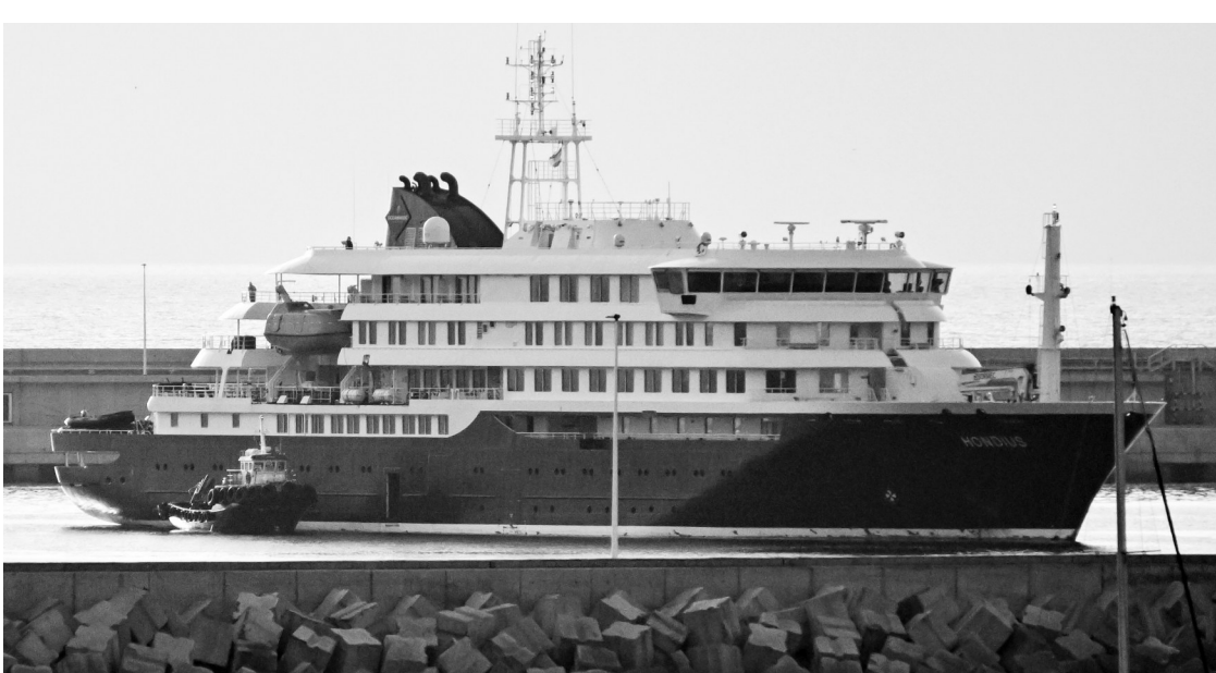
▲5月10日,在西班牙特内里费岛格拉纳利亚港,一艘橡皮艇靠近涉汉坦病毒疫情邮轮“洪迪厄斯”号,带领首批疏散人员离船。

加西亚表示,西班牙籍乘客将首先被转运撤离,荷兰方面随后将转运本国公民以及来自德国、比利时、希腊的乘客和部分船员。其余人员则将根据航班安排陆续离开。最后一架撤离航班预计于11日起飞,用于转运澳大利亚公民。荷兰方面还计划于11日派出一架“收尾”航班,转运届时尚未获得各