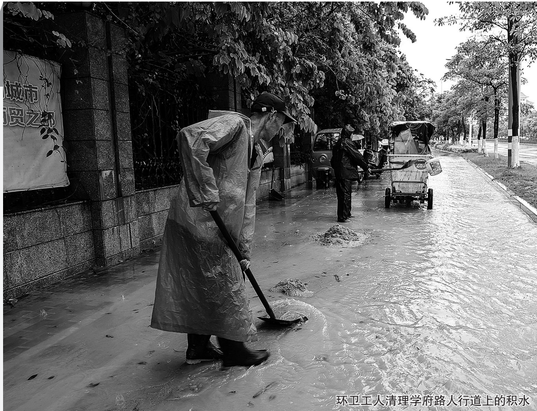
环卫工人清理学府路人行道上的积水

14日凌晨，石狮市气象局先后发布暴雨蓝色预警信号、雷电黄色预警信号，并于当日8时30分发布“暴雨预警Ⅳ级”，至16时15分解除“暴雨预警Ⅳ级”。本轮降雨给市民出行带来不便，个别路段出现积水现象，在交警、环卫等部门的努力下，积水被及时消除，道路恢复畅通。