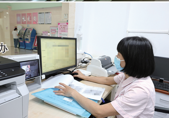
数据通过云端流转至各部门审核

“符合条件即可通过‘一件事’通道全程网办，无需再跑多个部门。”该负责人介绍，自改革推进以来，石狮市已累计办理“新生儿出生一件事”业务超