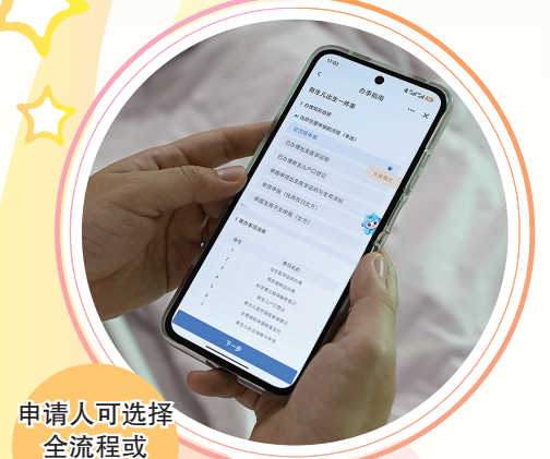
申请人可选择全流程或单项申报