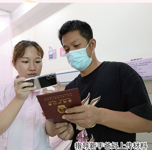
指导新手爸妈上传材料