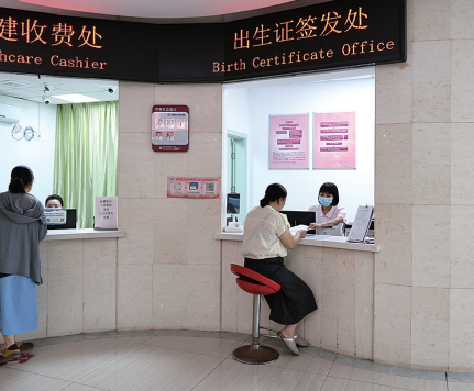
制证完成后可选择自取或邮寄