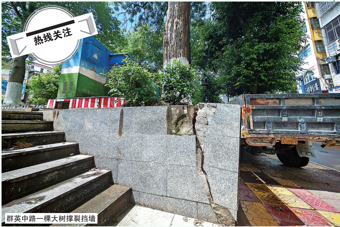
群英中路一棵大树撑裂挡墙