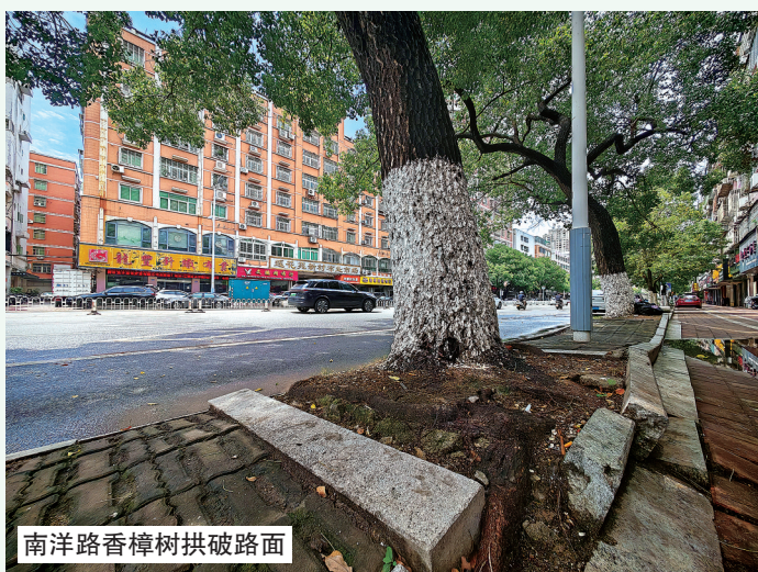
南洋路香樟树拱破路面

高考前夕,在南海生成的热带低压最终未编号为第7号台风,阵雨天气却给石狮带来了数日的凉爽。不过,根据气候预测,2026年登陆或影响我市的台风个数预计5至7个。当前仍处于主汛期,防汛防台风仍是一场持久战。